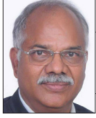
लिलामणि पोखरेल राजनीतिज्ञ