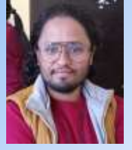
सुरजमाथा शून्य सभेक्षक, नापी कार्यालय बेलौरी