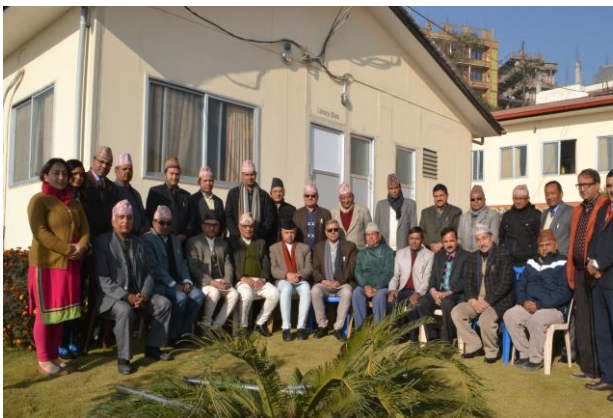
जिल्ला अदालतको विस्तारित क्षेत्राधिकारसम्बन्धी प्रशिक्षणमा सहभागी माननीय न्यायाधीशज्यूहरूको सामूहिक तस्विर

त्यस प्रशिक्षण कार्यक्रमको उद्देश्य जिल्ला अदालतको क्षेत्राधिकार सम्बन्धी वर्तमान संबैधानिक र कानूनी व्यवस्थाको विषयमा सहभागीहरूलाई सुपरिचित गराउने रहेको थियो। अ.व. १७ नं. को कानूनी व्यवस्था र त्यस अन्तर्गतका निवेदन, पुनरावेदन दर्ताको कार्यविधि र सुनुवाई प्रकृया तथा सो क्रममा आउने सम्भावित समस्या र सोको निराकरण, शुरु क्षेत्राधिकारमा समेटिने मुद्दाका साथै करार ऐन, २०५६ को दफा ८७ र त्यसको प्रयोगसम्बन्धी जानकारी गराउने रहेको