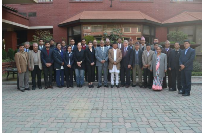
प्रतिष्ठानका कार्यकारी निर्देशक एवं CTED र GCCS का प्रतिनिधिहरूसँग सहभागीहरू

संयुक्त राष्ट्र संघको Counter -Terrorism Committee Executive Directorate (CTED) and Global Center on Cooperative Security (GCCS) सँगको सहकार्यमा विशेष अदालतमा कार्यरत न्यायाधीश तथा अधिकृत, सरकारी वकील, प्रहरी अधिकृतहरूलाई लक्षित गरी २०७३ माघ २४ गतेदेखि २६ गतेसम्म सम्पत्ति शुद्धीकरण र आतंकवादी क्रियाकलापमा हुने वित्तीय लगानीसम्बन्धी कसूर निवारण विषयक तीन दिवशीय प्रशिक्षण कार्यक्रम सम्पन्न भएको थियो। सम्पत्ति शुद्धीकरण र आतंकवादी क्रियाकलापमा हुने