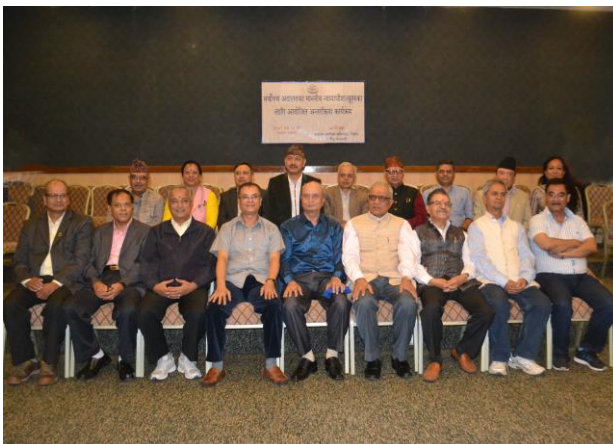
अन्तर्क्रिया कार्यक्रममा सहभागी सर्वोच्च अदालतका माननीय न्यायाधीशज्यूहरू

२०७३ भाद्र २५ गते काठमाडौंमा सर्वोच्च अदालतका न्यायाधीशहरूको एक दिवसीय अन्तर्क्रिया कार्यक्रम सम्पन्न भएको थियो। कार्यक्रममा सर्वोच्च अदालतका १८ जना न्यायाधीशहरूको सहभागिता