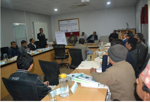
छलफल सत्रमा सहभागी अर्ध-न्यायिक निकायमा कार्यरत कर्मचारीहरू

उक्त कार्यक्रमहरूको उद्देश्य अर्धन्यायिक निकायको मुद्दा शाखामा कार्यरत कर्मचारीहरूले मुद्दाका सन्दर्भमा अपनाउनु पर्ने कार्यविधि, न्याय र कानूनका आधारभूत पक्ष र सेवाग्राहीसँग गरिनु पर्ने व्यवहारका