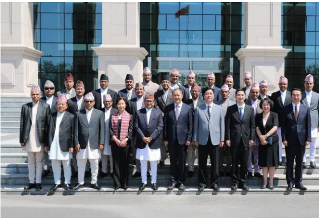
Chinaमा आयोजित नेपालका न्यायाधीशहरूको सेमिनारमा सहभागी माननीय न्यायाधीश र कर्मचारीहरूका साथमा प्रतिष्ठानका कार्यकारी निर्देशकज्यू

National Judges' College China, Supreme People's Court of the People's Republic of China र China Ministry of Commerce ले मे ३१, २०१७ देखि जुन १५, २०१७ सम्म आयोजना गरेको Nepali