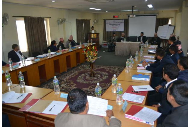
कार्यक्रमको समदघाटन सत्रमा सम्बोधन गर्नु हुँदै कार्यकारी निर्देशकज्यू

२९ गतेसम्म प्रतिष्ठानको मनमैजु र हरिहरभवन स्थित प्रशिक्षण कक्षमा सम्पन्न भएका थिए। यस कार्यक्रमको उद्देश्य फौजदारी मुद्दाहरूमा वैज्ञानिक प्रमाणहरूको आवश्यकता, महत्व र प्रयोग सम्बन्धमा जानकारी गराउनु रहेको थियो। लाश जाँच वा शव परीक्षण प्रतिवेदन, घाउ जाँच प्रतिवेदन, पीडितको स्वास्थ्य परीक्षण प्रतिवेदन, लागूऔषध परीक्षण प्रतिवेदन, उमेर निर्धारण तथा डि.एन्.ए. (DNA) परीक्षणको प्राविधिक पक्ष र यसमा