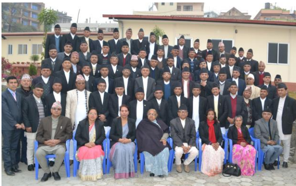
उच्च अदालतका नवनियुक्त माननीय न्यायाधीशज्यूहरू सँग सामुहिक तस्विर खिचाउँदै तत्कालीन सम्माननीय प्रधानन्यायाधीश श्री सुशीला कार्कीज्यू

नेपालको संविधान जारी भए पश्चात गठन भएको उच्च अदालतहरूमा ८० जना न्यायाधीशहरूको नियुक्ति र पदस्थापन भएको थियो। उक्त नवनियुक्त माननीय न्यायाधीश मध्ये तत्कालीन पुनरावेदन