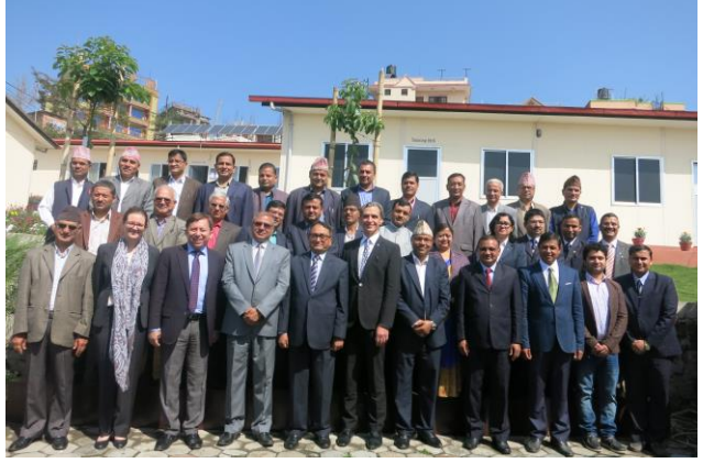
सहभागीहरू सँगको सामूहिक तस्विर

आईसीआरसी नेपालसँगको सहकार्यमा उच्च अदालत एवम् जिल्ला अदालतका माननीय न्यायाधीश र सरकारी वकीलहरूका लागि २०७४ वैशाख ११ र १२ तथा २०७४ वैशाख १४ र १५ गते दुई वटा अन्तर्राष्ट्रिय मानवीय कानून विषयक कार्यशाला सम्पन्न भयो। उक्त कार्यक्रममा अन्तर्राष्ट्रिय मानवीय कानूनको सैद्धान्तिक पक्ष, अन्तर्राष्ट्रिय फौजदारी कानून र अन्तर्राष्ट्रिय मानव अधिकार कानून तथा अन्तर्राष्ट्रिय मानवीय कानूनका प्रमुख सिद्धान्तहरू, अन्तर्राष्ट्रिय मानवीय कानून र मानव अधिकार कानूनको प्रयोगमा न्यायिक संयन्त्रहरू जस्ता विषयहरूमा प्रस्तुतीकरण र छलफल भएको थियो। स्वदेश तथा विदेशका मानव अधिकार तथा मानवीय कानूनका विज्ञहरूले कार्यशालामा सहजीकरण गर्नु भएको थियो। मनमैजु स्थित प्रतिष्ठानको प्रशिक्षण कक्षमा सञ्चालित दुईवटा कार्यशालामा ३६ जना जिल्ला न्यायाधीश, र ८ जना सरकारी वकीलहरू गरी ४४ जनाको सहभागिता रहेको थियो। सहभागीहरूको विवरण अनुसूची ३२(क) र ३२(ख) मा समावेश गरिएको छ।