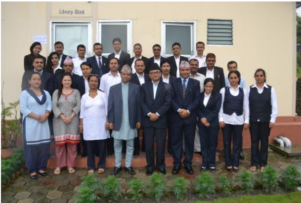
प्रशिक्षण कार्यक्रमका सहभागी सरकारी वकीलज्यूहरू सँग सामूहिक तास्विर खिचाउँदै कार्यकारी निर्देशकज्यू

महान्यायाधिवक्ताको कार्यालय र अन्तर्गतका सरकारी वकील कार्यालयहरूमा कार्यरत राजपत्रांकित तृतीय श्रेणीका सरकारी वकीलहरूलाई लक्षित गरी मिति २०७३ भाद्र २६ गतेदेखि ३० गतेसम्म उपर्युक्त