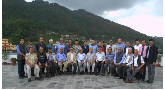
अन्तर्क्रियामा सहभागी वरिष्ठ अधिवक्ताहरू सँगको सामूहिक तस्विर

२०७४ असार २ र ३ गते वरिष्ठ अधिवक्ताहरूका लागि अन्तर्क्रिया कार्यक्रम सम्पन्न भएको थियो। स्वयम सेवी कानूनी सेवा (प्रो बोनो सर्भिस)को महत्व र प्रयोगको सन्दर्भमा छलफल गर्ने, नेपालको वर्तमान फौजदारी न्याय प्रणालीको बारेमा अन्तर्क्रिया गर्ने तथा प्रतिष्ठानको प्रयोजनको लागि प्रशिक्षणको आवश्यकताको विषय पहिचान गर्ने उद्देश्यले उक्त कार्यक्रम सञ्चालन गरिएको थियो।