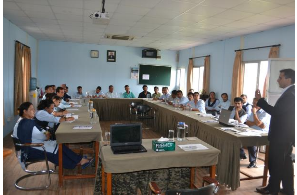
क्षमता विकास सम्बन्धी प्रशिक्षण कार्यक्रम सहभागी प्रतिष्ठानका कर्मचारीहरू

राष्ट्रिय न्यायिक प्रतिष्ठानका सहायक तथा श्रेणी विहीन कर्मचारीहरूलाई लक्षित गरी मिति २०७३ साउन ३० गतेदेखि ३२ गतेसम्म तीन दिवसीय क्षमता विकाससम्बन्धी प्रशिक्षण कार्यक्रम मनमैजु स्थित राष्ट्रिय न्यायिक प्रतिष्ठानको प्रशिक्षण कक्षमा सञ्चालन भयो। उक्त प्रशिक्षण कार्यक्रमको उद्देश्य प्रतिष्ठानमा कार्यरत सहायक कर्मचारीहरूको कार्य सम्पादनसँग सम्बन्धित व्यावहारिक पक्षबारे ज्ञान, सीप, दक्षता र दृष्टिकोणमा परिवर्तन ल्याई कार्य सम्पादनमा चुस्तता ल्याउने, प्रभावकारी रूपमा आफ्नो जिम्मेवारी वहन गर्न उत्प्रेरित गर्ने, आफूले सम्पादन गर्नुपर्ने काम र कर्तव्यको प्रभावकारी रूपमा सम्पादन एवम् प्रयोग गर्ने, क्षमता विकास गर्ने लगायतका विषयहरू समेटिएको थियो। कार्यक्रममा २१ जना कर्मचारीहरूको सहभागिता रहेको थियो। सहभागीहरूको विवरण अनुसूची ५ मा समावेश गरिएको छ।