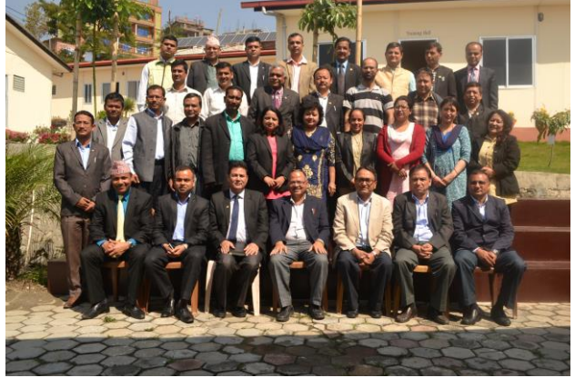
रिट क्षेत्राधिकार विषयक अन्तर्क्रिया कार्यक्रममा सहभागी कानून व्यवसायहीहरू

लामो अनुभवप्राप्त कानून व्यवसायीहरूका लागि लक्षित गरी २०७४ बैशाख २२ गते अन्तर्क्रिया कार्यक्रम प्रतिष्ठानको मनमैजु स्थित प्रशिक्षण कक्षमा सम्पन्न भएको थियो। कार्यक्रममा २५ जनाको सहभागिता रहेको थियो। नयाँ संविधान जारी भएको सन्दर्भमा सर्वोच्च अदालत तथा उच्च अदालतको रिट क्षेत्राधिकार अन्तर्गत उत्प्रेषण तथा परमादेशको संवैधानिक व्यवस्था र यसको प्रयोगको अवस्थाकोबारेमा जानकारी गराउने, सर्वोच्च अदालत तथा मातहतका अदालतको रिट क्षेत्राधिकार अन्तर्गत बन्दी प्रत्यक्षीकरण, प्रतिषेध र अधिकारपृच्छाको संवैधानिक व्यवस्था र यसको प्रयोगको अवस्था तथा नेपालको संविधानमा व्यवस्था भएको रिट क्षेत्राधिकारको प्रयोगको संभावना, चुनौती र कानून व्यवसायीको भूमिकाको विषयमा अन्तर्क्रिया गराउने उद्देश्यका साथ उक्त कार्यक्रम सञ्चालन गरिएको थियो।