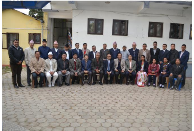
कार्यक्रम संयोजन समूहसँग कार्यक्रमका सहभागीहरू

दि एशिया फाउण्डेसनसँगको सहकार्यमा २०७३ मंसिर १३ र २०७३ मंसिर २६ गते पुनः स्थापकीय न्यायसम्बन्धी कार्यशालाहरू सम्पन्न भए। पुनः स्थापकीय न्यायको अवधारणा, कानूनी व्यवस्था, कार्यान्वयनमा रहेका समस्या र समाधानको उपायहरू, अन्तर्राष्ट्रिय अभ्यास तथा पुनः स्थापकीय न्यायको सन्दर्भमा नेपालको कानूनमा भएको व्यवस्था लागूतका विषयहरूमा छलफल गर्ने उद्देश्यले उक्त कार्यशाला आयोजना गरिएको थियो। कार्यशालामा जिल्ला न्यायाधीश, न्याय तथा कानून समूहका अधिकृतहरू र कानून व्यवसायीहरूको सहभागिता रहेको थियो। कार्यशालाहरूको विवरण यसप्रकार छः