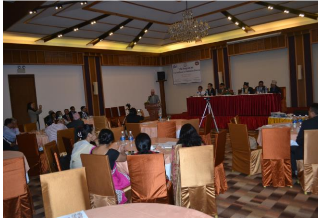
मेलमिलाप सम्बन्धी प्रवचन कार्यक्रमको एक झलक