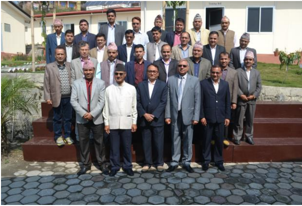
प्रतिष्ठानका कार्यकारी निर्देशक एवं संयोजन समूहसँग सहभागी जिल्ला न्यायाधीशहरूको सामूहिक तस्विर

जिल्ला न्यायाधीशहरूलाई लक्षित गरी २०७३ चैत्र २० गतेदेखि २४ गतेसम्म वाणिज्य प्रकृतिका