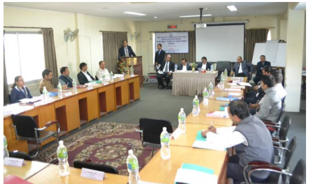
कानून तर्जुमा र कानूनी राय सम्बन्धी प्रशिक्षण कार्यक्रमको उद्घाटन सत्रमा मन्तव्य राख्नुहुँदै .....

नेपाल न्याय सेवा, कानून समूहका राजपत्राङ्कित तृतीय श्रेणीका अधिकृतहरूलाई लक्षित गरी २०७४ जेठ १० गतेदेखि १२ गतेसम्म कानून तर्जुमा र कानूनी रायसम्बन्धी प्रशिक्षण कार्यक्रम प्रतिष्ठानको हरिहरभवन स्थित प्रशिक्षण कक्षमा सम्पन्न भएको थियो। कानून तर्जुमा, विधि निर्माणको प्रक्रिया,