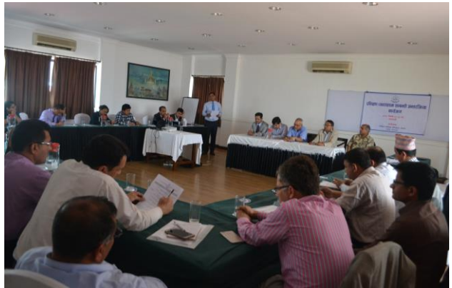
अन्तर्क्रिया कार्यक्रममा सहभागी प्रतिष्ठानका कर्मचारी एवं वरिष्ठ प्रशिक्षक तथा व्यवस्थापन विज्ञहरू

प्रतिष्ठानका प्राज्ञिक निर्देशक तथा कर्मचारीहरू र बाह्य स्रोतव्यक्तिहरूबीच २०७४ बैशाख २२ र २३ गते प्रशिक्षण व्यवस्थापनसम्बन्धी अन्तर्क्रिया कार्यक्रम सम्पन्न भयो। प्रशिक्षण व्यवस्थापनका नविनतम अवधारणाका बारेमा छलफल गर्ने तथा प्रशिक्षण सञ्चालन गर्दा देखिएका समस्या, चुनौती