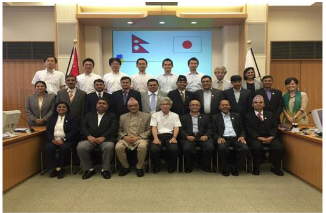
जापानमा आयोजित मुद्दा व्यवस्थापन र मेलमिलाप सम्बन्धी सेमिनारमा सहभागीहरू