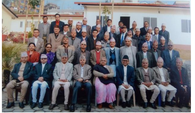
तत्कालीन सम्माननीय प्रधानन्यायाधीश श्री सुशीला कार्कीज्यूसँग सहभागीहरू