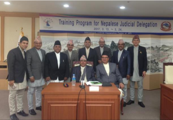
प्रतिष्ठानका वरिष्ठ प्राज्ञिक निर्देशक कोरियाली न्यायिक प्रणालीको अवलोकनको क्रममा सहभागीहरूसँग

आ) दक्षिण कोरियाको सर्वोच्च अदालतको निमन्त्रणामा कोरियाली न्याय प्रणालीको अध्ययन एवम् न्यायिक निकायहरूको अवलोकन भ्रमणको लागि प्रतिष्ठानका वरिष्ठ प्राज्ञिक निर्देशक एवम् उच्च