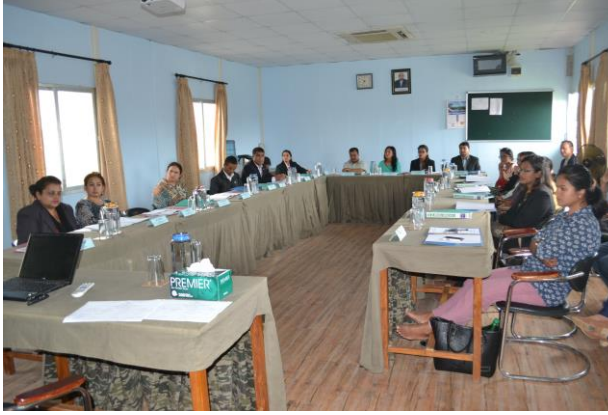
वहसकला र व्यवसायिक दक्षता अभिवृद्धि सम्बन्धी प्रशिक्षण कार्यक्रममा सहभागी नवप्रवेशी कानून व्यवसायीहरू

जम्मा ५८ जना नवप्रवेशी कानून व्यवसायीहरूको सहभागिता रहेको थियो। सहभागीहरूको विवरण अनुसूची ६(क), ६(ख) र ६(ग) मा समावेश गरिएको छ।