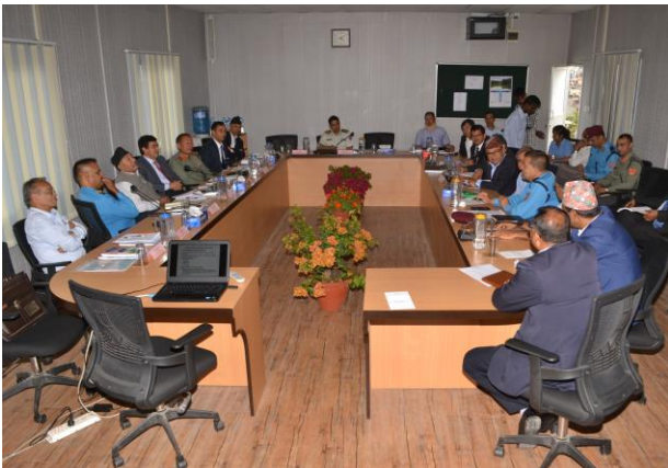
चौथो प्रशिक्षण प्रतिष्ठान राष्ट्रिय समन्वय समितिको बैठकको दृष्य

प्रशिक्षण प्रतिष्ठान राष्ट्रिय समन्वय समितिको चौथो बैठक राष्ट्रिय न्यायिक प्रतिष्ठानको आयोजनामा मिति २०७४ असार २० गते, प्रतिष्ठानको सभाकक्ष, मनमैजुमा सम्पन्न भयो। नेपालका प्रशिक्षण प्रदायक संस्थाहरूका प्रशिक्षण कार्यक्रम, प्रशिक्षण विधि, प्रशिक्षण व्यवस्थापन र प्रशिक्षणसँग सम्बन्धित अन्य कुराहरूमा आवश्यकता अनुसार समन्वय र एक रूपता नभई रहेको अवस्थामा प्रशिक्षण प्रदायक