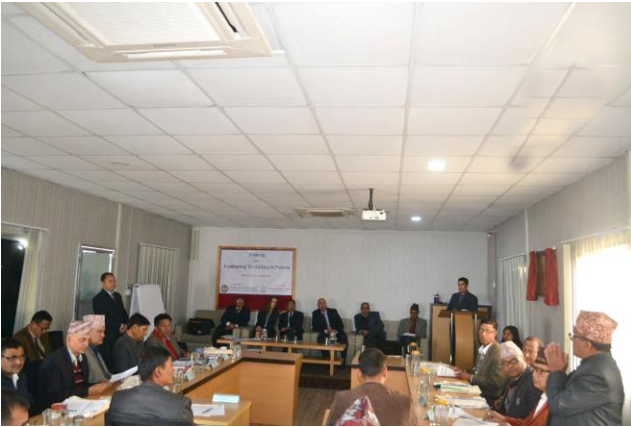
उद्घाटन सत्रमा आफ्नो परिचय दिँदै सहभागी

जिल्ला न्यायाधीश, सरकारी वकील, अदालतका अधिकृत र प्रहरीलाई लक्षित गरी मानव बेचबिखन रोकथामसम्बन्धी प्रशिक्षण कार्यक्रम २०७३ फाल्गुन २३ गतेदेखि २७ गतेसम्म