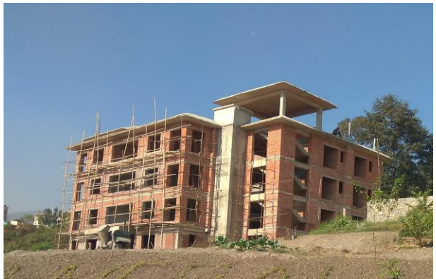
प्रतिष्ठानको निर्माणधिन प्रशिक्षार्थी आवासीय भवन

यस आ.व. मा प्रतिष्ठानको मनमैजु स्थित कार्यालय परिसरमा बहुवर्षीय योजना अन्तर्गत प्रशिक्षार्थी आवास भवन, सभा भवन र सुरक्षाकर्मी बस्ने भवन निर्माणाधीन अवस्थामा रहेको छ। प्रतिष्ठान परिसरको उत्तरपूर्व तर्फको तारबार हटाई पर्खाल लगाइएको छ। थप एक प्रशिक्षण कक्ष लगायतका विभिन्न निर्माण