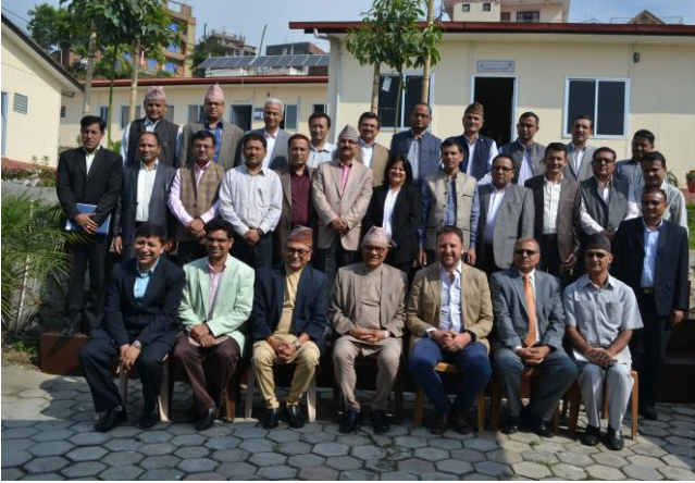
सम्माननीय प्रधानन्यायाधीश श्री गोपाल पराजुलीजूसँग सामूहिक तस्विर

जिल्ला अदालतका न्यायाधीशहरूलाई लक्षित गरी २०७४ जेठ १६ गतेदेखि १८ गतेसम्म जिल्ला अदालतको विस्तारित क्षेत्राधिकारसम्बन्धी प्रशिक्षण कार्यक्रम सम्पन्न भयो। उक्त प्रशिक्षण कार्यक्रममा नेपालको संविधानले शुरुतहको मुद्दा हेर्ने निकायको क्षेत्राधिकारमा ल्याएको आधारभूत परिवर्तनको