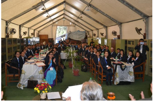
नवप्रवेशी न्याय सेवाका रा.प. तृतीय श्रेणीका अधिकृतहरूको तीन महिने तालिमको उद्घाटन समारोह

प्रशिक्षण कार्यक्रमको मुख्य उद्देश्य नवनियुक्त अधिकृतहरूलाई पदस्थापन भएको कार्यालयमा जिम्मेवारी सम्हाल्न जानुभन्दा अगावै कार्य सञ्चालनको सिलसिलामा आवश्यक पर्ने विभिन्न आधारभूत ज्ञान र व्यावहारिक सीप सिकाउने रहेको थियो। नेपाल सरकारको विभिन्न सेवाका अप्राविधिक तर्फका अधिकृतहरूका लागि सेवाप्रवेश प्रशिक्षण कार्यक्रमको अवधि ६ महिना बनाई सकिएको र यसलाई क्रमशः एक वर्ष पुऱ्याउने कार्यक्रम