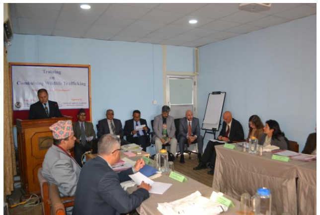
कार्यक्रमका उद्घाटन सत्र

चितवन, बारा, पर्सा, बर्दिया, मकवानपुर, रसुवा, नुवाकोट, कञ्चनपुर, काठमाडौं, सिन्धुपाल्चोक लगायतका जिल्ला अदालतहरूमा कार्यरत माननीय जिल्ला न्यायाधीश र सरकारी वकीलहरूका लागि लक्षित गरी २०७३ फागुन १६ गतेदेखि २० गतेसम्म वन्यजन्तु कसूर रोकथाम