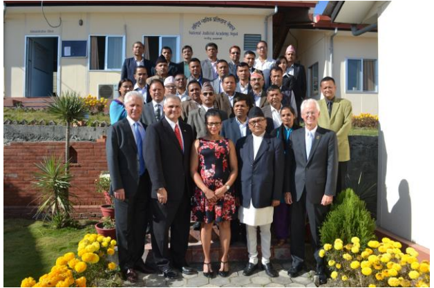
बयानको सम्झौता प्रक्रियासम्बन्धी प्रशिक्षण कार्यक्रमका सहभागीसँग प्रतिष्ठानका कार्यकारी निर्देशक एवं ओपीडीएटीका प्रतिनिधिहरू

न्यायाधीश तथा सरकारी वकीलहरूलाई लक्षित गरी २०७३ कार्तिक १८ गतेदेखि २० गतेसम्म बयानको सम्झौता प्रक्रियासम्बन्धी दुई दिवसीय प्रशिक्षण कार्यक्रम युएस/डीओजे/ओपीडीएटीसँगको सहकार्यमा राष्ट्रिय न्यायिक प्रतिष्ठानको मनमैजु स्थित प्रशिक्षण कक्षमा सम्पन्न भएको थियो। सहभागीहरूलाई फौजदारी मुद्दाको अभियुक्त र अभियोक्ताबीच हुने बयानको सम्झौता प्रक्रिया, संरचना, नीति तथा यसको व्यावहारिक पक्षको बारेमा जानकारी गराउने उद्देश्यले यो कार्यक्रम सञ्चालन गरिएको थियो। कार्यक्रममा बयानको सम्झौता प्रक्रियाको अवधारणा, सिद्धान्त, अन्तर्राष्ट्रिय अभ्यास, नेपालको कानूनी व्यवस्था, बयानको सम्झौताको फाइदा तथा बेफाइदा लगायतका विषयहरूमा विभिन्न सत्रहरूमा छलफल भएको थियो। सत्रहरू सहजीकरणका लागि अमेरिकी अभियोजनकर्ताहरूको समेत उपस्थिति रहेको थियो। कार्यक्रममा १४ जना जिल्ला न्यायाधीश तथा ८ जना सरकारी वकीलहरू गरी जम्मा २२ जनाको सहभागिता रहेको थियो। सहभागीहरूको विवरण अनुसूची २६ मा समावेश गरिएको छ।