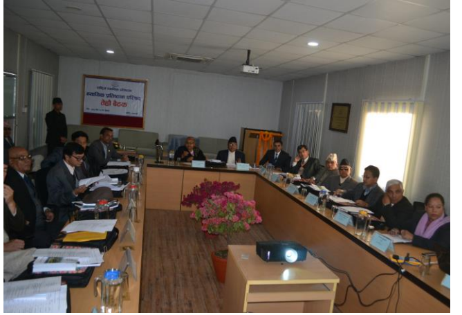
न्यायिक प्रतिष्ठान परिषद्को तेह्रौं बैठक