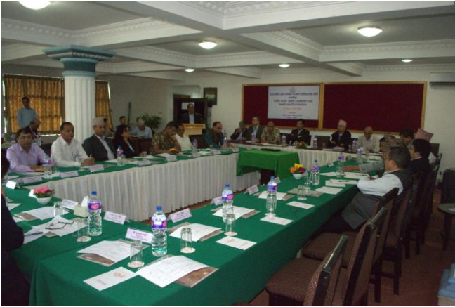
अन्तर्क्रिया कार्यक्रममा सहभागी न्याय सेवा, सरकारी वकिल समूहका रा.प प्रथम श्रेणीका अधिकृतहरू

महान्यायाधिवक्ताको कार्यालय र अन्तर्गतका राजपत्रांकित प्रथम श्रेणीका सरकारी वकीलहरूका लागि २०७४ जेठ ५ र ६ गते संगठित अपराध: चुनौति र सम्बोधनका उपाय सम्बन्धी अन्तर्क्रिया कार्यक्रम सम्पन्न भएको थियो। संगठित अपराधसम्बन्धी अन्तर्राष्ट्रिय अवधारणा र विकास, संगठित अपराधसम्बन्धी