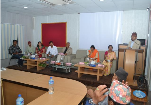
स्थानीय तहका निर्वाचित पदाधिकारीहरू प्रतिष्ठानको स्वागत कार्यक्रममा सहभागी हुँदै

२०७४ असार १४ गते राष्ट्रिय न्यायिक प्रतिष्ठानले प्रतिष्ठान अवस्थित तारकेश्वर नगरपालिकाका नवनिर्वाचित पदाधिकारीहरूको लागि स्वागत तथा शुभकामना कार्यक्रमको आयोजना गरेको थियो। उक्त