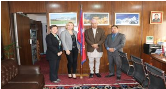
माननीय अर्थमन्त्री र अन्तर्राष्ट्रिय वित्त निगम (IFC) का एशिया तथा प्रशान्त क्षेत्रका क्षेत्रीय उपाध्यक्षबीच शिष्टाचार भेट