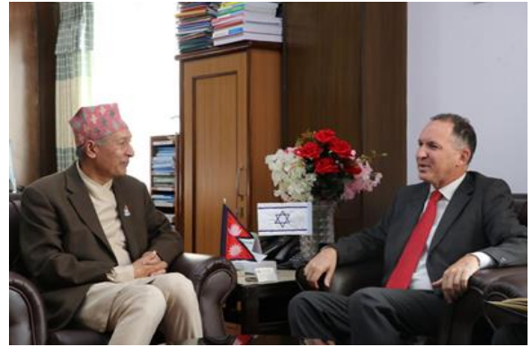
माननीय अर्थमन्त्री डा. युवराज खतिवडासँग इजरायली अन्तर्राष्ट्रिय विकास निगमका प्रमुखको भेटवार्ता