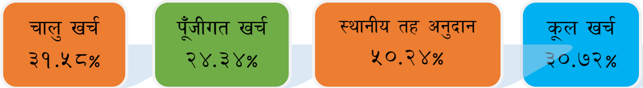
चार्ट (क) - तीन आर्थिक वर्षको चैत्र मसान्तसम्मको खर्चको अवस्था

१. चालु आ.व.२०८२/८३ को चैत्र महिनासम्म वार्षिक विनियोजनको तुलनामा चालु खर्च, पूँजीगत खर्च, स्थानीय तह अनुदान र कूल खर्चको प्रगति प्रतिशत देहाय अनुसार रहेको छ:-