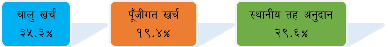
चार्ट (क)- तीन आर्थिक वर्षको माघ मसान्तसम्मको खर्चको अवस्था (रकम रु.लाखमा)

१. चालु आ.व.२०८१/८२ को माघ महिनासम्म वार्षिक विनियोजनको तुलनामा २८.४ प्रतिशत खर्च भएको छ। जसमध्ये चालु, पूँजीगत र स्थानीय तह अनुदानको खर्च प्रतिशत देहाय अनुसार रहेको छ:-