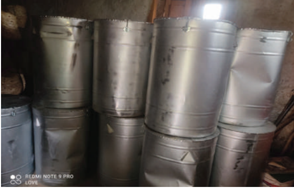
चन्दननाथ नगरपालिका, जुम्ला - सिडबिन वितरण