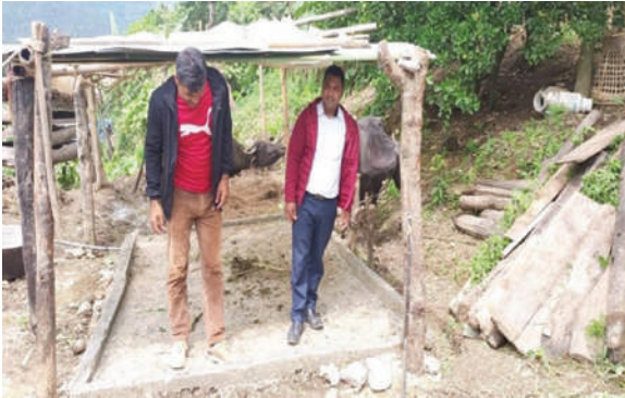
सिद्धिचरण न.पा., ओखलढुङ्गा - भकारी सुधार कार्यक्रम