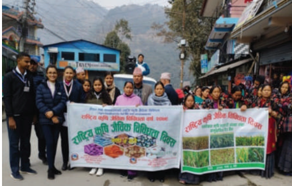
कृषि ज्ञान केन्द्र, लमजुङ