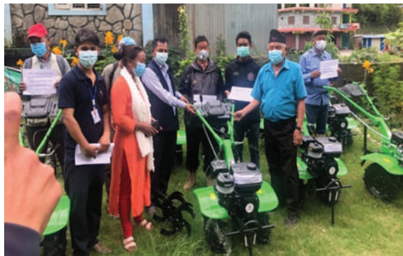
अन्नपूर्ण गाउँपालिका, म्याग्दी - रैथाने बाली प्रवर्द्धन अन्तर्गत मेसिनरी सहयोग