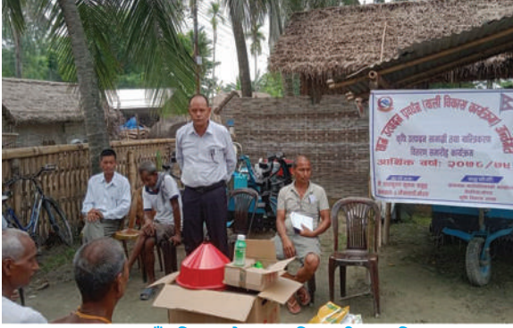
ग्रामथान गाउँपालिका, मोरङ - कृषि यान्त्रीकरण वितरण