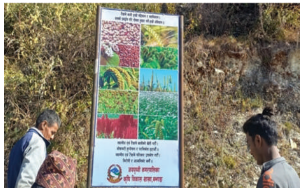
जयपृथ्वी नगरपालिका, बझाङ्ग- सचेतनामुलक होर्डिङ बोर्ड स्थापना