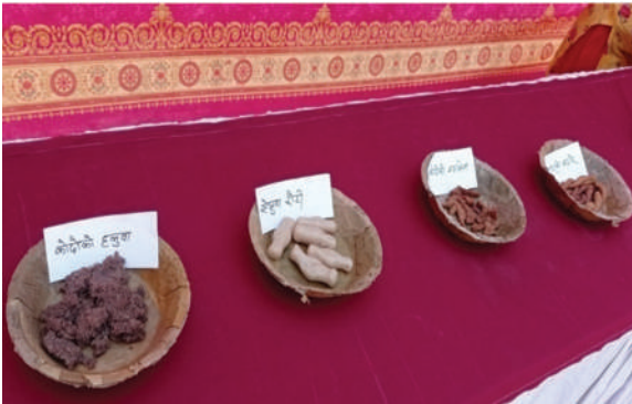
कावासोती नगरपालिका, नवलपरासी - रैथाने परिकार प्रदर्शनी