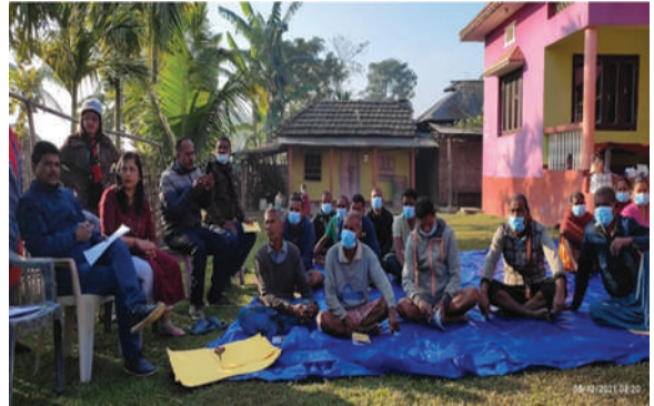
दुहबी नगरपालिका, सुनसरी - कृषकस्तरमा छलफल