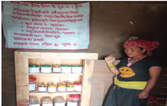
त्रिपुरासुन्दरी नगरपालिका, डोल्पा - सामुदायिक बीउ बैंक