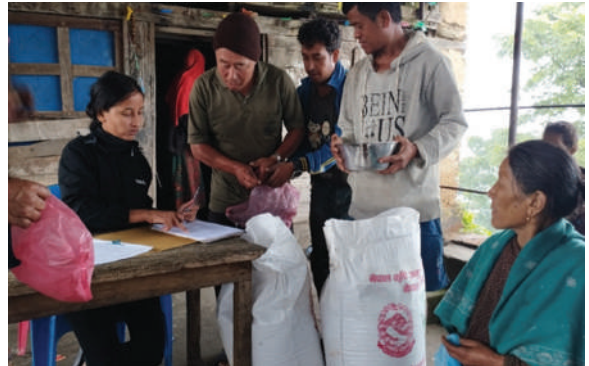
बेसीशहर नगरपालिका, लमजुङ्ग-कोदोको सिङ किट वितरण