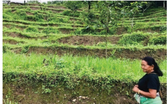
बारापाक सुलिकोट गाउँपालिका, गोरखा - बाँझो जमिनमा कोदो खेती