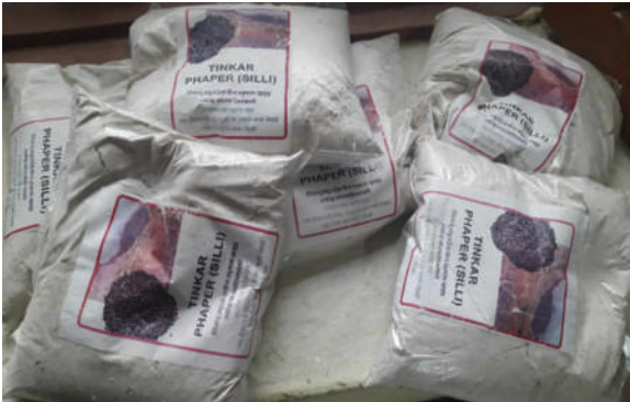
ब्यास गा.पा., दार्चुला - रैथाने बाली ब्राण्डिङ्ग तथा प्याकेजिङ्ग