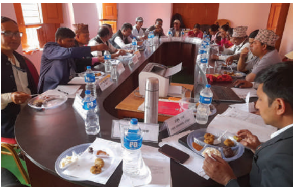
पाटन न.पा., बैतडी - कार्यपालिकाको बैठकमा रैथाने खाजा परिकार खाइदै