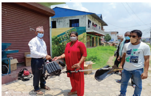
गैडाकोट नगरपालिका, नवलपरासी- मकै गोड्ने मेसिन वितरण