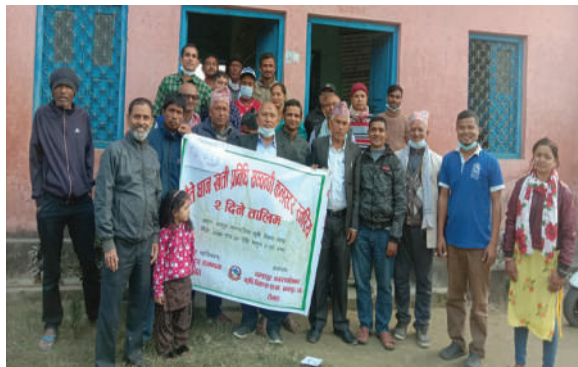
चन्द्रनगर न.पा., रौतहट - चैते धान खेती सम्बन्धी कृषक तालिम