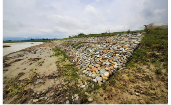
कटानबाट फार्मको जग्गा, पूर्वाधार जोगाउन तटबन्धन, आ.व. २०७६/७७