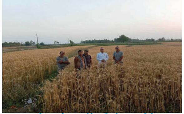
लालबन्दी नगरपालिका, सर्लाही - गहुँबाली अनुगमन निरीक्षण