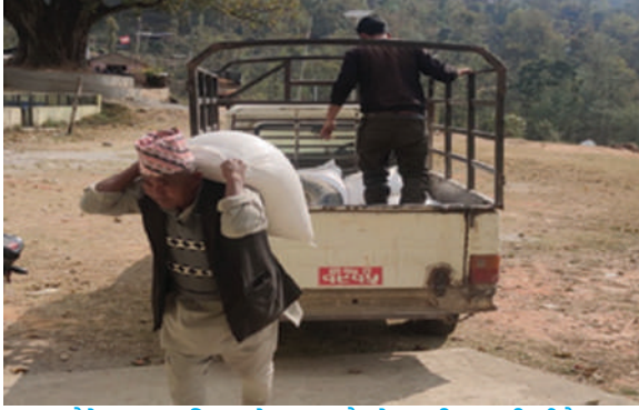
बैतेश्वर नगरपालिका, दोलखा - मकैको मुल बीउ डुवानी गरिदै