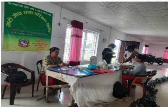
हल्दीबारी गाउँपालिका, झापा - माटो जाँच तथा परीक्षण शिविर