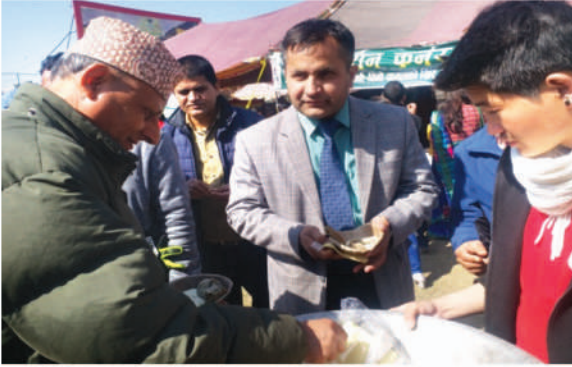
१२औं राष्ट्रिय प्रांगारिक कृषि मेलामा तथा बृहत कर्णाली एक्सपो २०७६