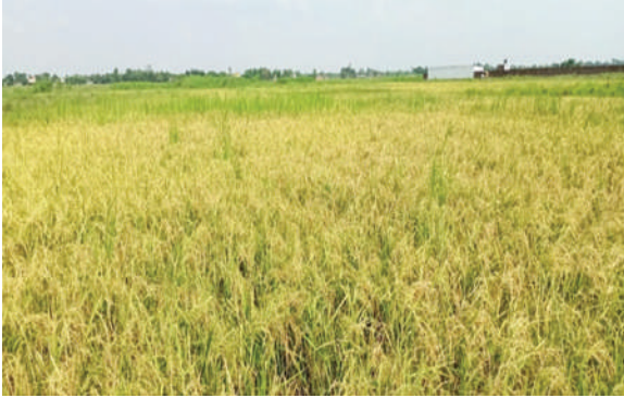
वाणगंगा नगरपालिका, कपिलवस्तु - चैते धान लार्ज बृहद क्षेत्र प्रदर्शन