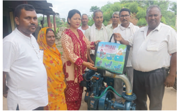
रामग्राम नगरपालिका, नवलपरासी ब.सु.प. - कृषि सामग्री वितरण