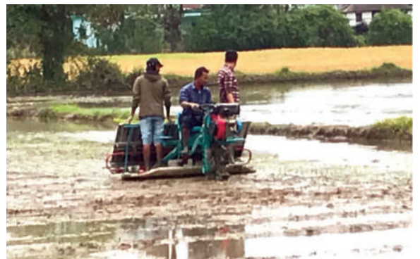
चैते धानको बीउ उत्पादन तयारी, आ.व. २०७९/८०