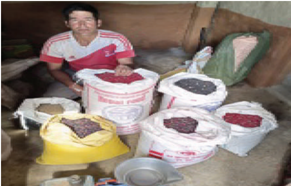
तातोपानी गा.पा., जुम्ला - सिमी, कागुनो, चिनो, मार्से र फापर बीउ वितरण