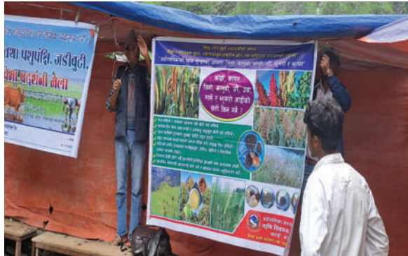
बडीमालिका न.पा., बाजुरा - ब्यानर, स्टल मार्फत रैथाने बालीको प्रचार प्रसार