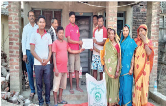
कृषि ज्ञान केन्द्र, बारा