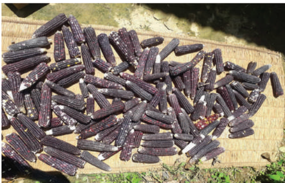
भूमिकास्थान न.पा., अर्घाखाँची - रैथाने कालो मकैको बीउ वितरण (जातीय परीक्षण)