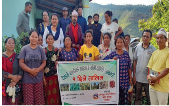
धनकुटा नगरपालिका, धनकुटा - तालिम सञ्चालन