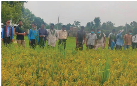
बासँगढी न.पा., बर्दिया - चैते धान खेती पहिलोपटक नपामा शुरुवात