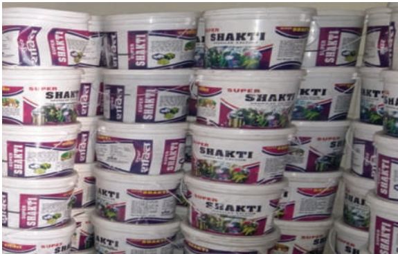
तिला गाउँपालिका, जुम्ला - जैविक मल वितरण