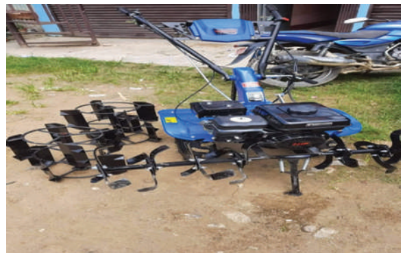
खाँदबारी न.पा., सङ्खुवासभा - कृषकलाई उपलब्ध गराइएको मिनिपावर टिलर