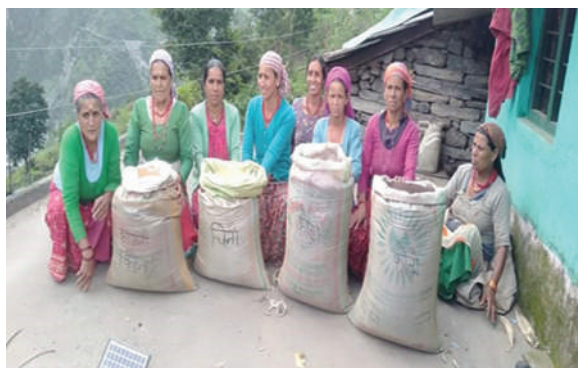
ब्यास गाउँपालिका, दार्चुला - रैथाने बाली बीउ वितरण