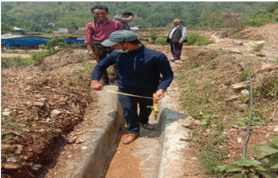
वालिङ्ग नगरपालिका, स्याङ्गजा - साना सिंचाई निर्माण कार्यक्रम