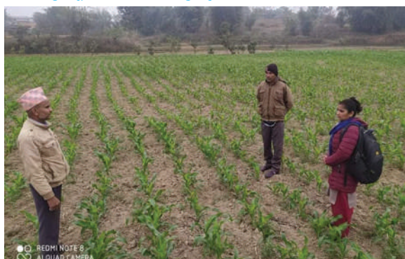
दुधौली नगरपालिका, सिन्धुली