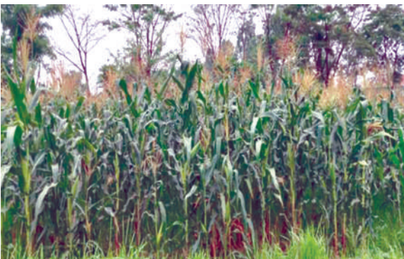
मेसिन तथा हातले रोपेको रामपुर कम्पोजिट मकै प्रदर्शन, आ.व. २०७९/८०