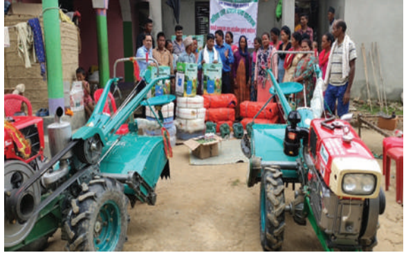
बारबर्दिया नगरपालिका, बर्दिया - सामग्री हस्तान्तरण गर्दै