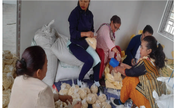
धनकुटा नगरपालिका धनकुटा - मकैको बीउ वितरण