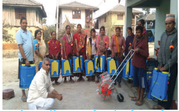
तालबन्दी न.पा., सर्लाही - अनुदानमा कृषि चुन, स्प्रेयर र सिड प्लान्टर वितरण