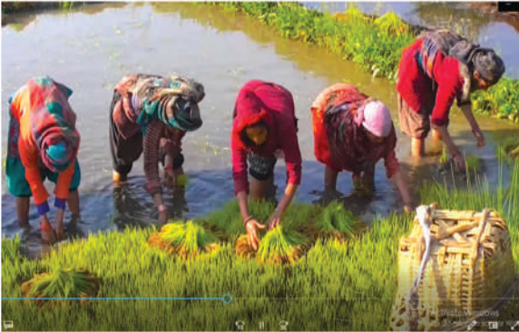
जुम्ली मार्सी धानको वृत्तचित्र तयारी, आ.व. २०७६/७७