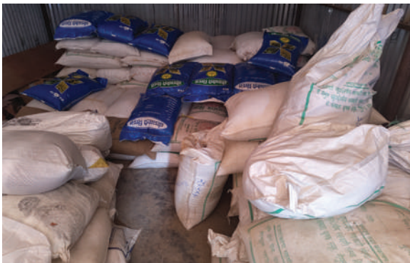
दिपायल सिलगढी नगरपालिका, डोटी - धानको बीउ वितरण