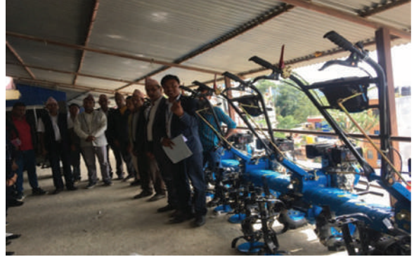
सिद्धिचरण न.पा., ओखलढुङ्गा - ५०% अनुदानमा मिनिटिलर वितरण