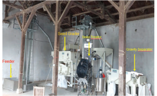
बीउ प्रशोधन तथा उपचार प्लान्ट, आ.व. २०७८/७९