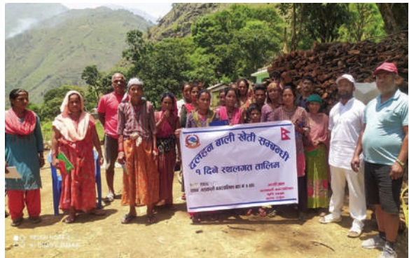
महाकाली नगरपालिका, दार्चुला- दलहन बाली सम्बन्धी तालिम सञ्चालन