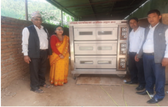
सन्धिखर्क न.पा., अर्घाखाँची - होटल रेस्टुरेन्टलाई रैथाने परिकार बनाउन ओभन र पिठो मिक्कर वितरण