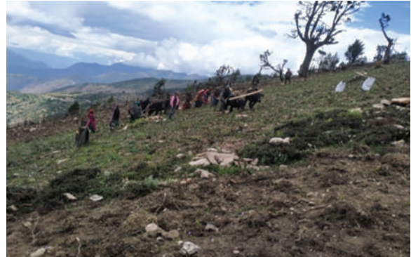
खत्याड गाउँपालिका, मुगु - फापरको क्षेत्र विस्तार गर्दै