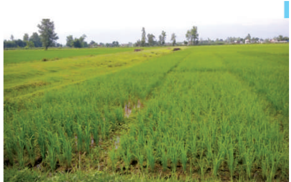
रैथाने जातका धानको diversity block, आ.व. २०७८/७९