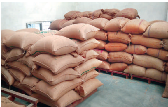
धानको बीउ बिक्रीको लागि प्याकेजिङ्ग, आ.व. २०७९/८०