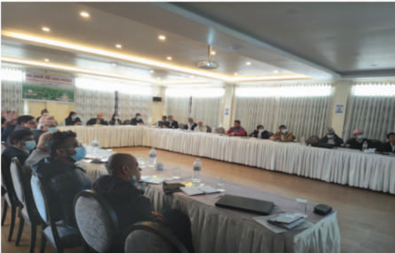
Rice Policy Dialogue सञ्चालन, आ.व. २०७८/७९