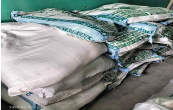
सुन्दरहरैँचा न.पा., मोरङ - हरियो मल ढेचा र जिङ्क वितरणको लागि तयारी