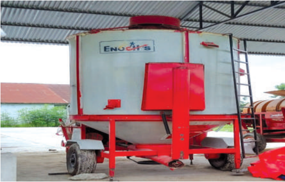
कृषि यान्त्रिकरण सिकाई केन्द्र स्थापना, आ.व. २०७७/७८