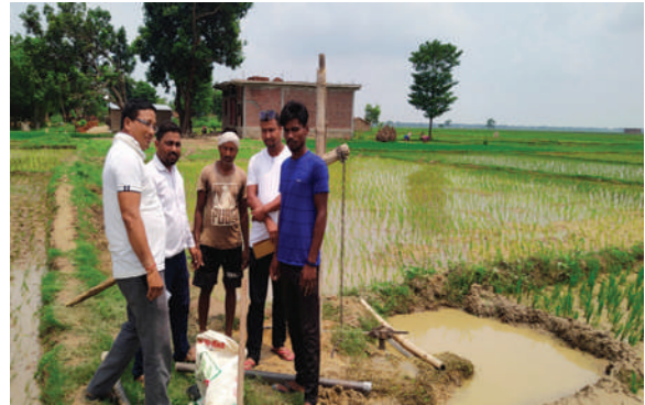
सरावल गाउँपालिका, नवलपरासी - धानबाली कार्यक्रम अनुगमन