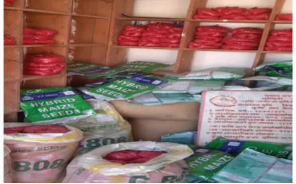
सन्धिखर्क नगरपालिका, अर्घाखाँची - बीउ तथा मल वितरण