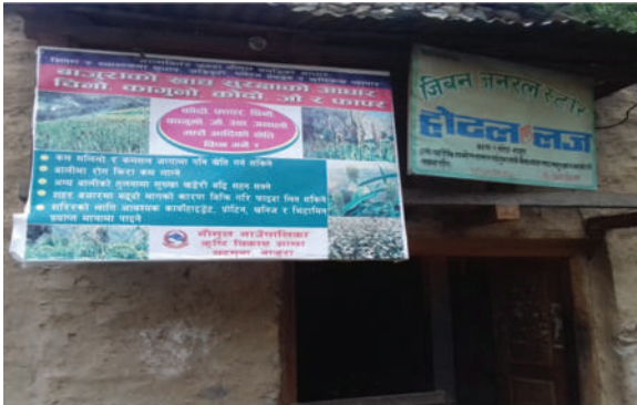
गौमुल गा.पा., बाजुरा - होर्डिंग बोर्डबाट रैथाने बालीको प्रचार प्रसार