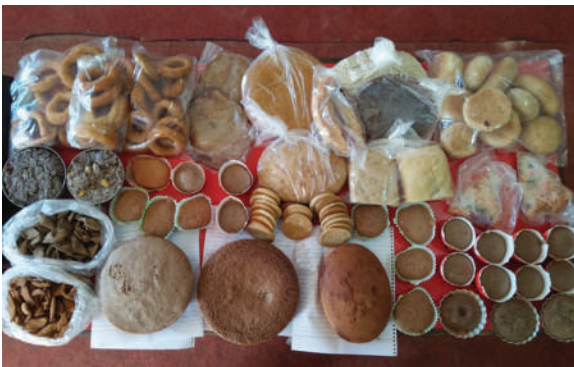
मकवानपुरगढी गाउँपालिका- रैथाने परिकार तयारी तथा प्रदर्शनी