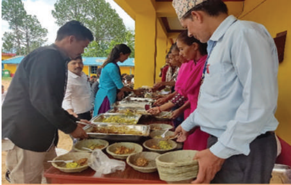
नारायण न.पा., दैलेख - विद्यालय दिवा खाजामा रैथाने बाली परिकार खुवाईदै