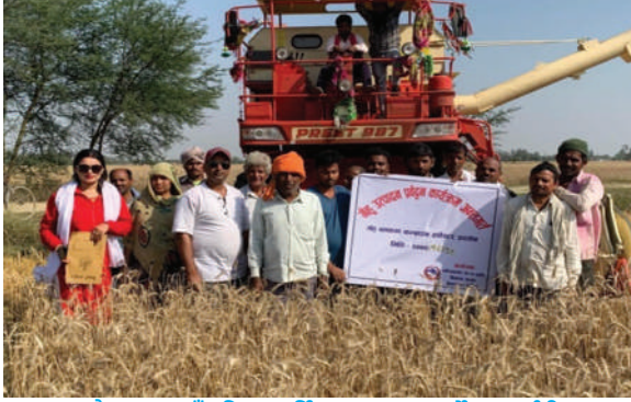
बढैयाताल गाउँपालिका, बर्दिया - कम्वाइन हाभेष्टर प्रदर्शनी