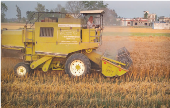
गहुँ बीउ बाली कटानी तथा भण्डारण, आ.व. २०७८/७९