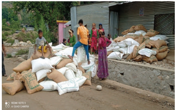
दिपायल सिलगढी नगरपालिका, डोटी - बीउ वितरण