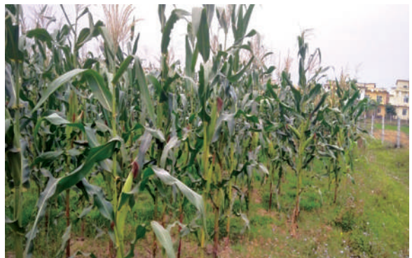
अरुण २ जातको मकैको मूल बीउ उत्पादन, आ.व.२०७९/८०