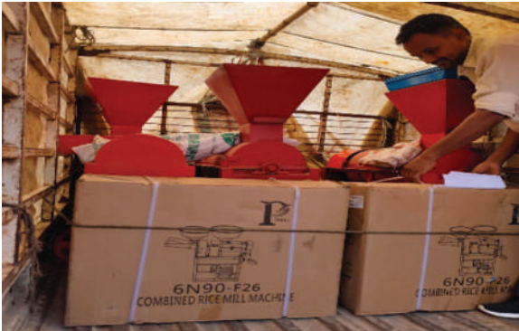
मध्यनेपाल न.पा., लमजुङ्ग - ५०% अनुदानमा मिलेट थ्रेसर र कम्बाइन्ड मिल वितरण