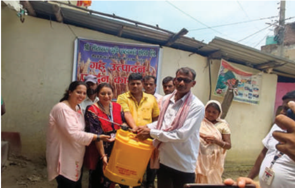
वीरगंज महानगरपालिका, पर्सा - कृषि सामग्री वितरण