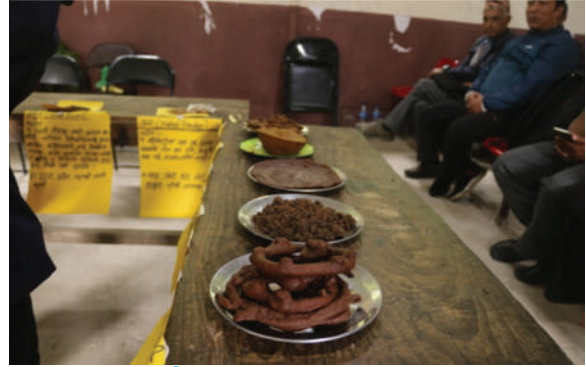
जिरी न.पा., दोलखा - रैथाने बाली सम्बन्धी तालिम सञ्चालन, परिकार प्रदर्शनी