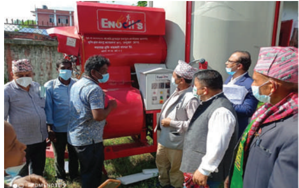
प्रदेश १ का मा.कृषि मन्त्रीज्यूबाट ड्रायर मेसिन हस्तान्तरण कार्यक्रम