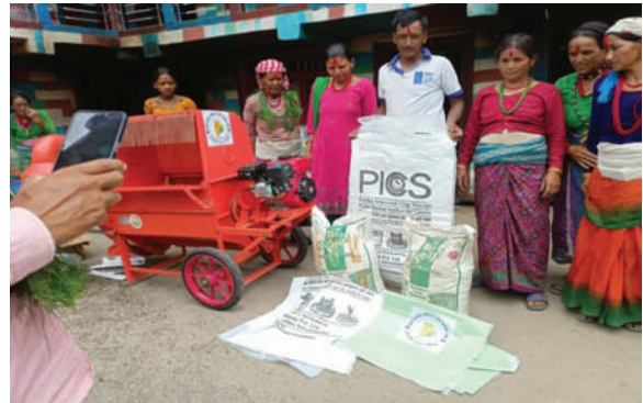
सान्नी त्रिवेणी गाउँपालिका कालिकोट- कृषि सामग्री वितरण