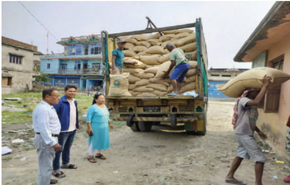
रामधुनी नगरपालिका, सुनसरी - धानको र ढैंचाको बीउ तथा जिंक वितरण