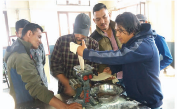
रैथाने बाली परिकार विविधिकरण प्रशिक्षक प्रशिक्षण, आ.व. २०७७/७८