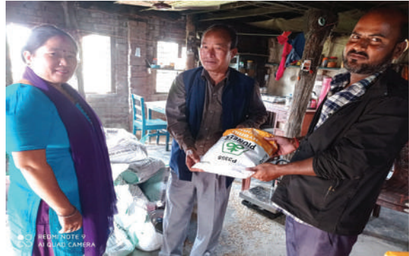
मकैको बीउ वितरण- रतुवामाई नगरपालिका, मोरङ