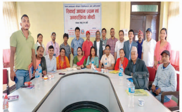
प्रशिक्षकहरूको सिकाई आदान प्रदान कार्यक्रम आ.व. २०७९/८०