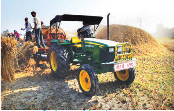
धान र गहुँ बालीमा उन्नत प्रविधि प्रदर्शन, आ.व. २०७५/७६