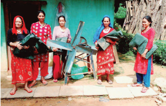
अलिताल गाउँपालिका डडेल्धुरा- कृषि सामग्री वितरण