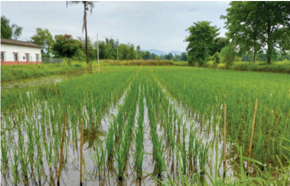
हर्दिनाथ हाइब्रीड-१ को बीउ उत्पादन, आ.व. २०७८/७९