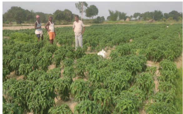
कृषि ज्ञान केन्द्र, सप्तरी