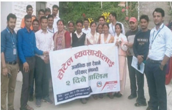
भेरी न.पा. जाजरकोट - तालिम सञ्चालन