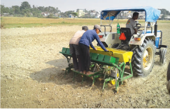
ड्रम सिडर र सिड ड्रिल मेसिनका साथ चैते धान उत्पादन, आ.व. २०७५/७६