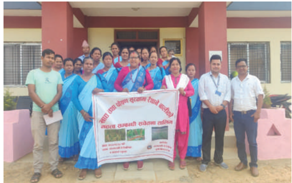
सुरमारानी गा.पा., प्युठान - रैथाने बालीको महत्व सम्बन्धी सचेतना तालिम