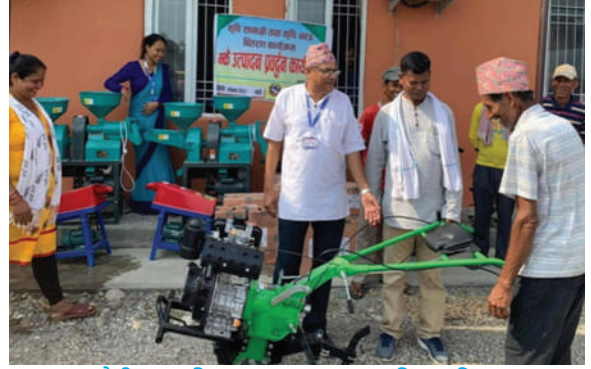
दुधौली नगरपालिका - ५०% अनुदानमा कृषि यन्त्र वितरण