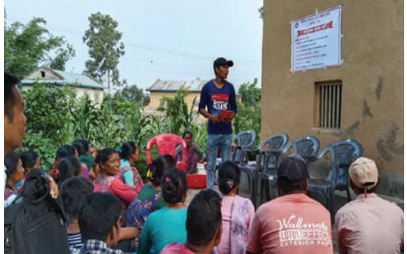
तुलसीपुर उ.म.न.पा., दाङ - धान ब्लक छनौट तथा नगरस्तरिय तालिम