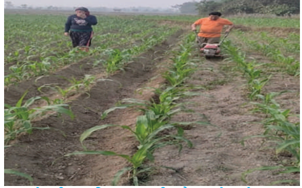
देवचुली नगरपालिका, नवलपरासी - मकै ब्लकको अवलोकन