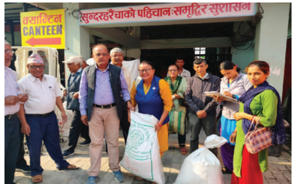
सुन्दरहरैँचा नगरपालिका, मोरङ्ग - कृषि सामग्री वितरण