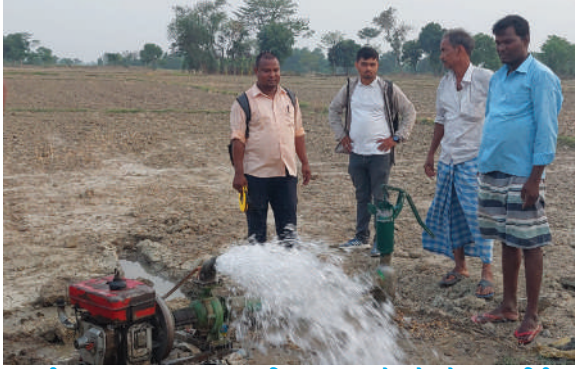
बारागढी न.पा., बारा- ८५% अनुदानमा जडित १५ वटा स्यालो ट्यूबेलको अनुगमन निरीक्षण