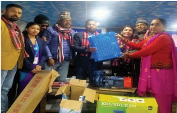
झापा गाउँपालिका, झापा - कृषि सामग्री वितरण