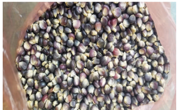
बाग्लुङ्ग न.पा. - मनकामना-३ र कालो मकैको बीउ वितरण