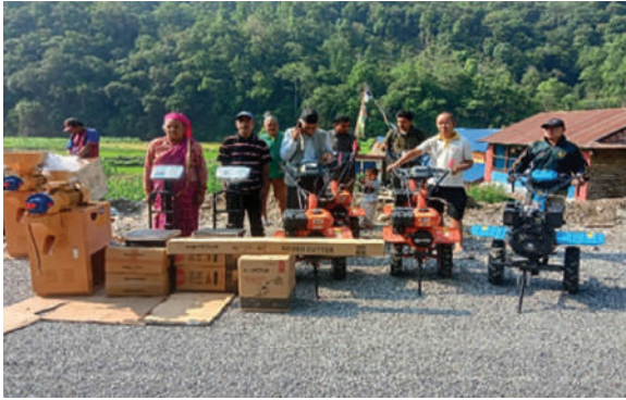
सुन्दरबजार नगरपालिका, लमजुङ्ग - कृषि सामग्री वितरण