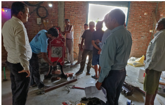
सियारी गा.पा., रुपन्देही - तेल मिल जडान