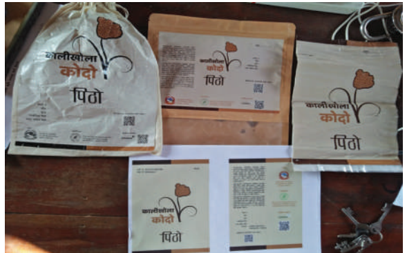
मकवानपुरगढी गा.पा., मकवानपुर - कालीखोला ब्रान्डको कोदोको पिठो