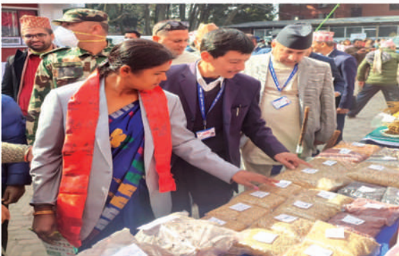
प्रथम राष्ट्रिय कृषि जैविक विविधता दिवस मूल समारोह, माघ ४, २०७९