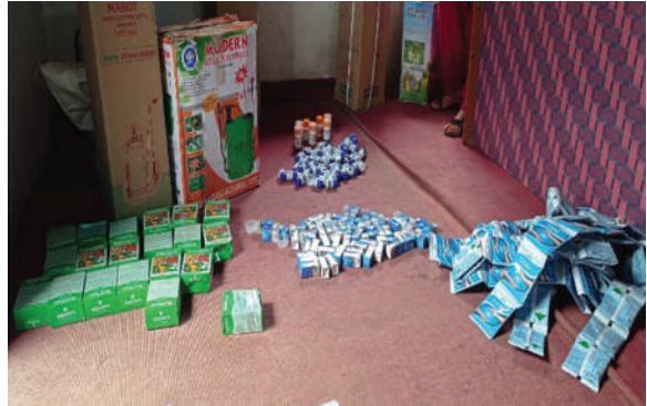
चौरपाटी गाउँपालिका, अछाम - मिनीकीट, सिड बिन वितरण