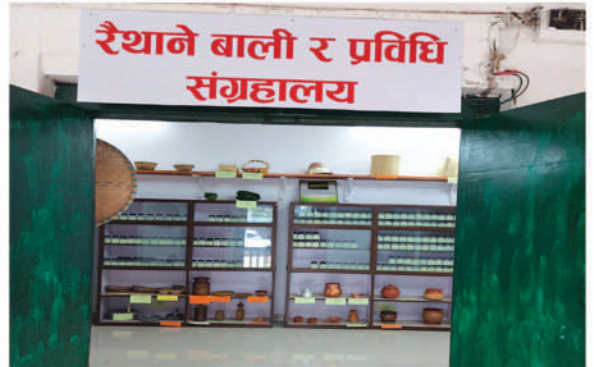
विभिन्न बाली, जात, प्रविधिको संरक्षण र Museum स्थापना, २०७८/७९