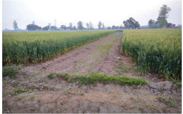
फार्म परिसरमा गहुँको मूल बीउ उत्पादन, आ.व. २०७७/७८