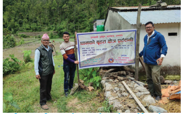
विठ्ठर नगरपालिका नुवाकोट- "धानको बृहत क्षेत्र प्रदर्शनी" कार्यक्रम