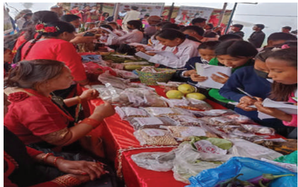
कोन्ज्योसोम गाउँपालिका, ललितपुर - कृषि जैविक विविधता मेला सञ्चालन