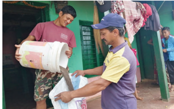
भानु नगरपालिका, तनहुँ - कोदोको बीउ वितरण