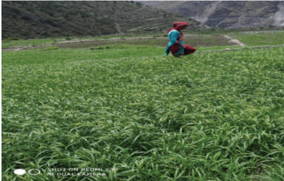
स्वामीकार्तिक खापर गाउँपालिका, बाजुरा - चिनो ब्लक