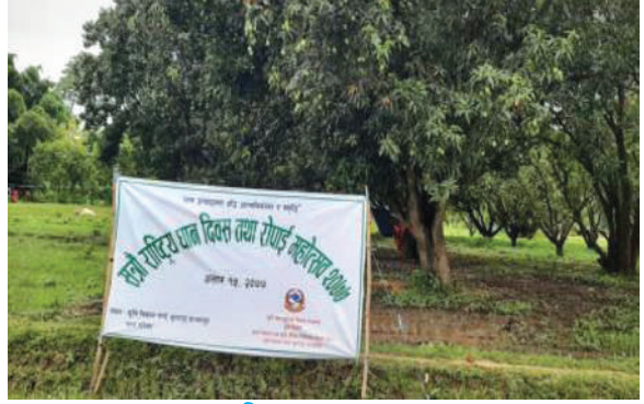
धान दिवस, आ.व. २०७६/७७