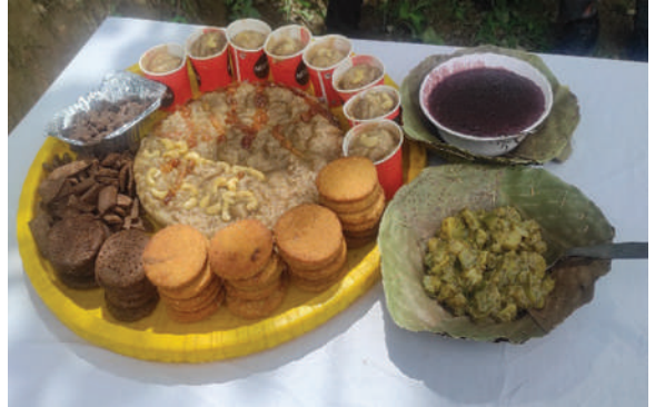
भेरी न.पा., जाजरकोट - रैथाने बाली परिकार बनाउने तालिम सञ्चालन