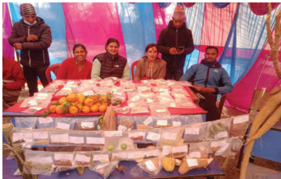
पोखरा महानगरपालिका, कास्की - कृषि जैविक विविधता सप्ताह