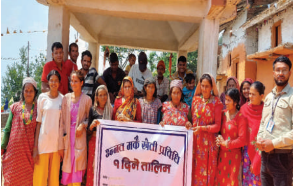
अमरगढी नगरपालिका, डडेल्धुरा - १ दिने तालिम सञ्चालन