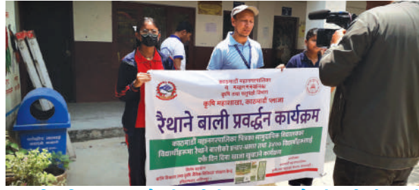
काठमाडौं महानगरपालिका - सामुदायिक विद्यालयहरूमा रैथाने बालीको प्रचार प्रसार र रैथाने बाली परिकारको दिवा खाजा खुवाउने कार्यक्रम