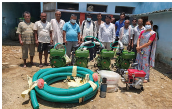
बुद्धभूमी न.पा., कपिलवस्तु - कृषि मेसिनरी सामग्री वितरण