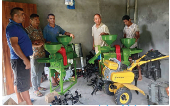
सुन्दरबजार नगरपालिका, लमजुङ - कम्बाईन मिल र मिनि टिलर वितरण