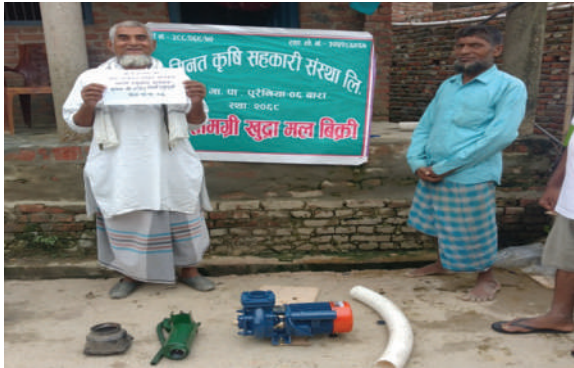
कृषि ज्ञान केन्द्र, बारा - ५३ वटा स्यालो ट्युब वेल जडान