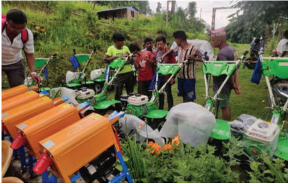
पञ्चकन्या गा.पा., नुवाकोट - ५०% अनुदानमा मिनिटिलर, कर्नसिलर र स्प्रेयर वितरण