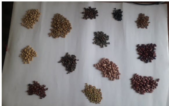
धनकुटा नगरपालिका, धनकुटामा पाइने रैथाने बालीहरु