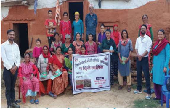
अमरगढी नगरपालिका, डडेल्धुरा - तालिम सञ्चालन