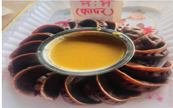
गौरीशंकर गा.पा., दोलखा - रैथाने बालीका परिकार तयारी सम्बन्धी तालिम