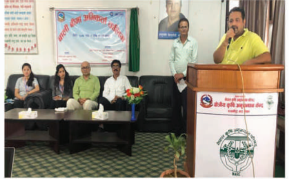
बाली बिमा अधिकर्ता तालिम, आ.व. २०७६/७७