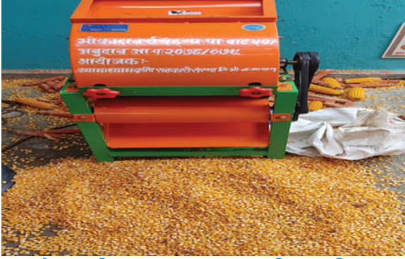
भोक्राहा नरसिङ गा.पा. - ५०% अनुदानमा कृषि यन्त्रहरू वितरण