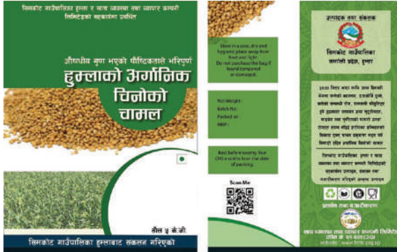
सिमकोट गाउँपालिका, हुम्ला - अर्गानिक चिनोको चामलको प्याकेट