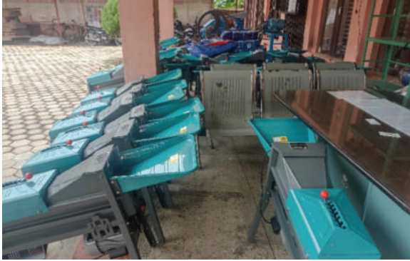
रत्ननगर नगरपालिका, चितवन - कृषि सामग्री वितरण