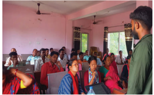
करैयामाई गा.पा., बारा - गड्यौले मल तथा कम्पोष्ट मल तयारी सम्बन्धी तालिम