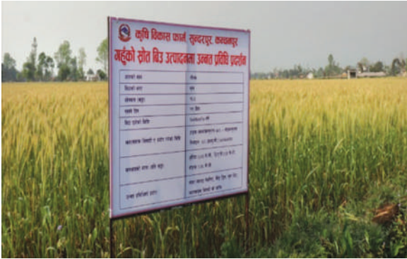
गहुँको श्रोत बीउ उत्पादनमा उन्नत प्रविधि प्रदर्शन, आ.व. २०७७/७८