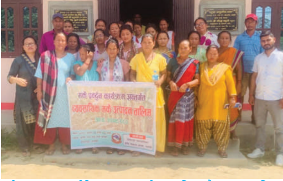
ईश्वरपुर न.पा., सर्लाही - कृषकहरूलाई व्यवसायिक मकै उत्पादन तालिम