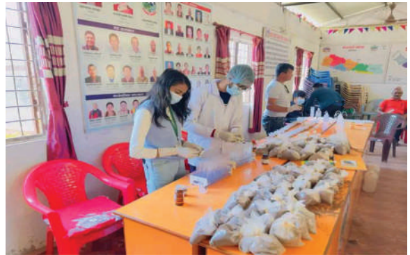
बगनासकाली गा.पा., पाल्पा - माटो परीक्षण शिविर