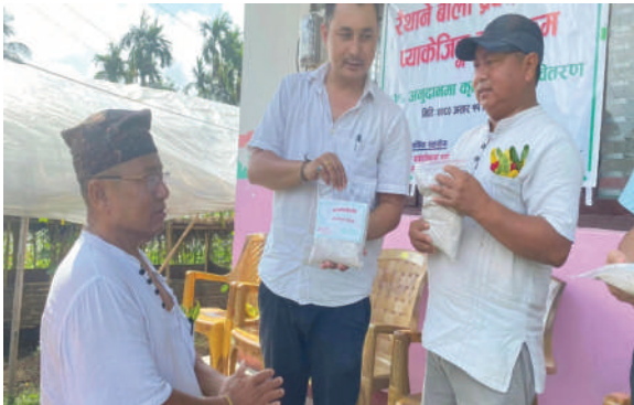
लेटाङ न.पा., मोरङ - कोदोको पिठो प्याकेजिङ तथा ब्राण्डिङ कार्यक्रम