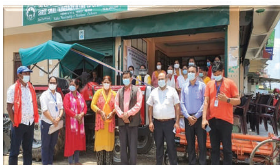
कालिका न.पा., चितवन - कष्टम हायरिड सेन्टर यान्त्रिकरण हस्तान्तरण