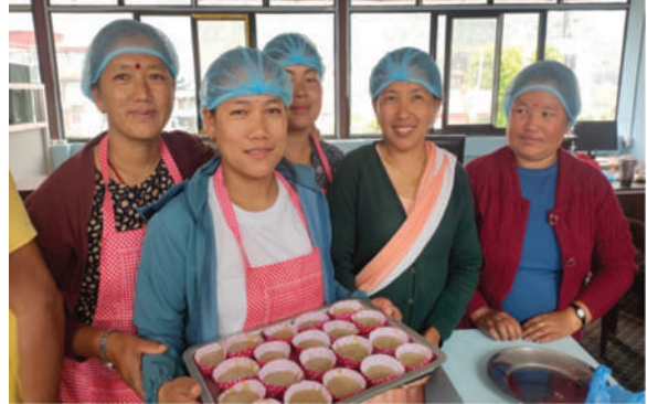
कृषि ज्ञान केन्द्र, लमजुङ