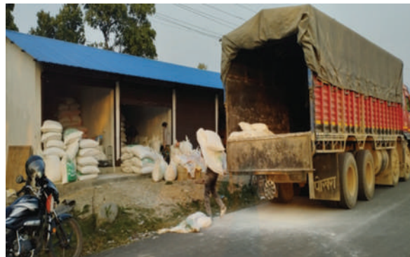
कालिका नगरपालिका, चितवन - कृषि चुन वितरण कार्यक्रम