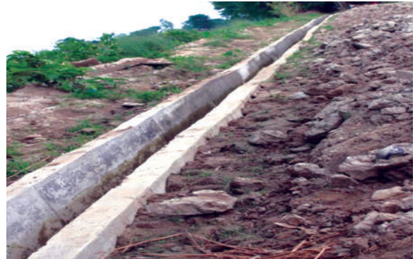
जिर्ण सिंचाइ कुलो मर्मत