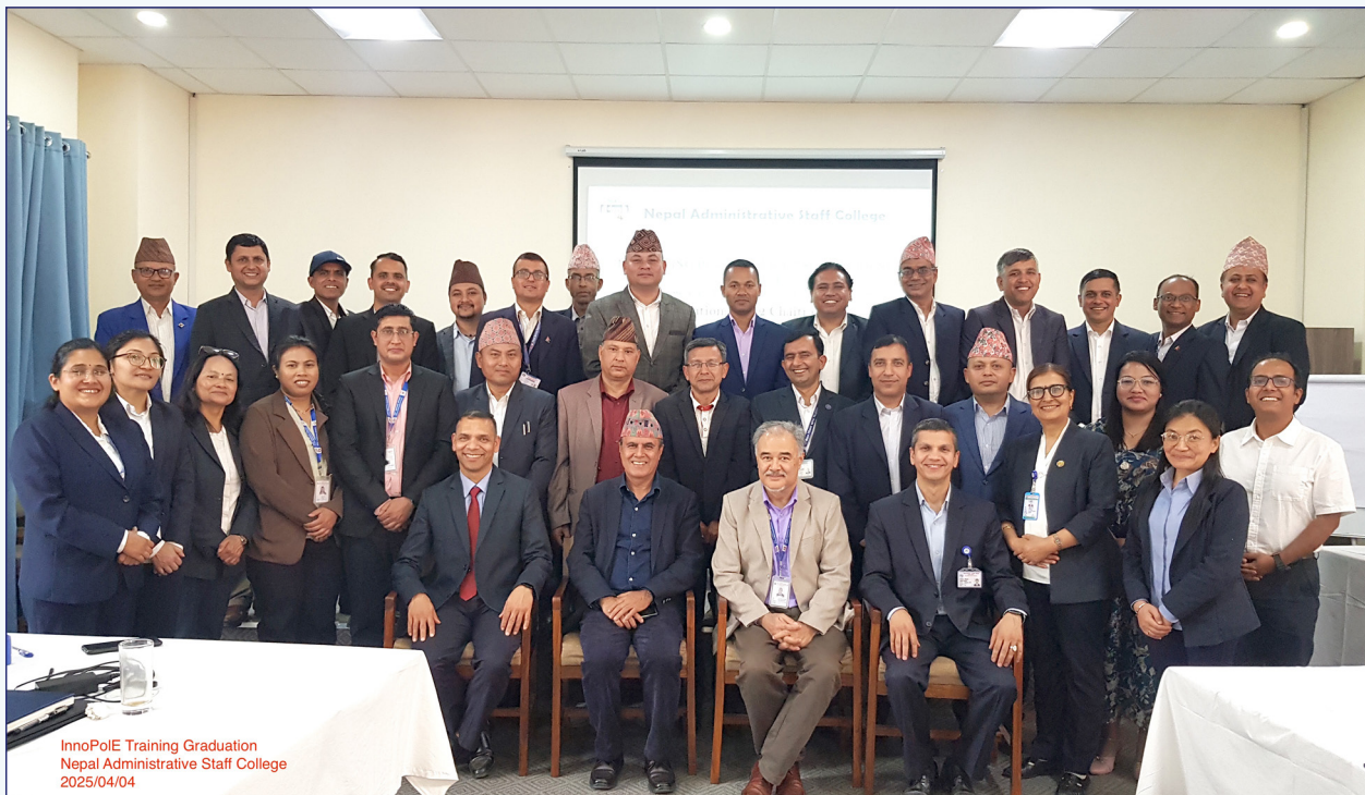
InnoPoIE Training Graduation Nepal Administrative Staff College 2025/04/04

सहभागिता रहेको थियो। प्रशिक्षण अवधिमा दुई-दिने सैद्धान्तिक कक्षा, दुई-दिने स्थलगत अध्ययन, दुई-दिने नीति मस्यौदाको तयारी र एक-दिने प्रस्तुतीकरण तथा पृष्ठपोषण कार्यक्रम सञ्चालन गरिएको थियो।