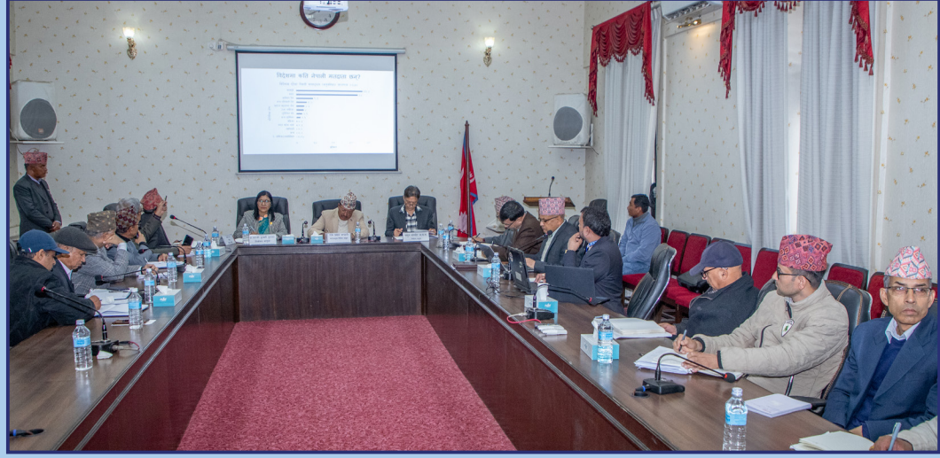
विदेशमा रहेका नेपाली नागरिक तथा निर्वाचन क्षेत्रबाहिर रहेका मतदातालाई मतदान अधिकार दिने व्यवस्था सम्बन्धमा नीति अनुसन्धान प्रतिष्ठानले सम्पन्न गरेको अध्ययनका निष्कर्षहरू निर्वाचन आयोगमा छलफल हुँदै