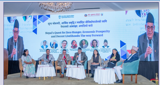
शून्य भोकमरी, आर्थिक समृद्धि र मर्यादित जीविकोपार्जन सम्बन्धमा नीति अनुसन्धान प्रतिष्ठान र नेपाल विकास अनुसन्धान प्रतिष्ठानद्वारा आयोजित कार्यक्रमको झलक