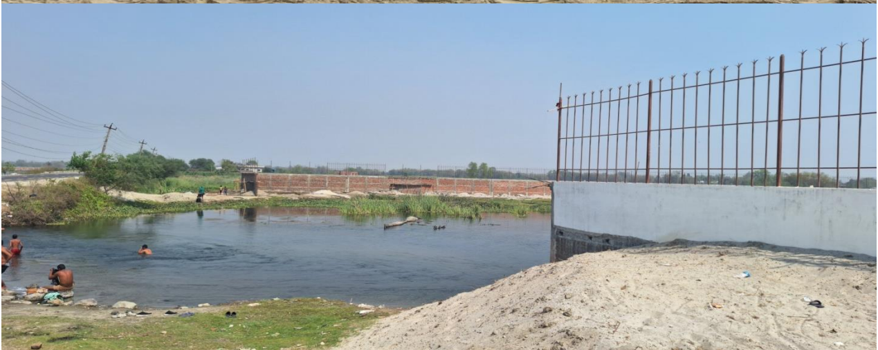
कोशी प्रदेश सरकारको निर्णयानुसार सार्वजनिक निजी साझेदारी अवधारणाबाट अघि बढाउन खोजिएको सुनसरी जिल्ला स्थित कोशी रिफ्रेशमेन्ट सेन्टर परियोजना