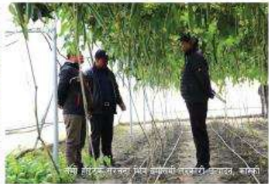
सर्वांगीण संरक्षित संरचनाको लागि, ग्याल्टरु-१०, कास्की