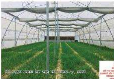
सर्वांगीण संरक्षित संरचनाको लागि, ग्याल्टरु-१०, कास्की