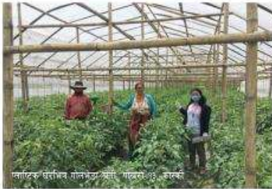
ग्याल्टरु संरक्षित संरचनाको लागि, ग्याल्टरु-१०, कास्की