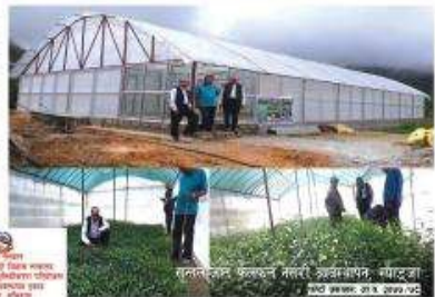
सर्वांगीण संरक्षित संरचनाको लागि, ग्याल्टरु-१०, कास्की

संरक्षित संरचनाको लागि, ग्याल्टरु-१०, कास्की