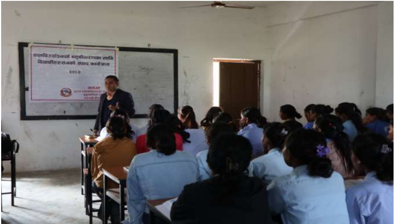
श्री शारदा माध्यमिक विद्यालय बैयाबेहडी, धनगढी उ.म.न.पा. वडा नं २-,कैलाली