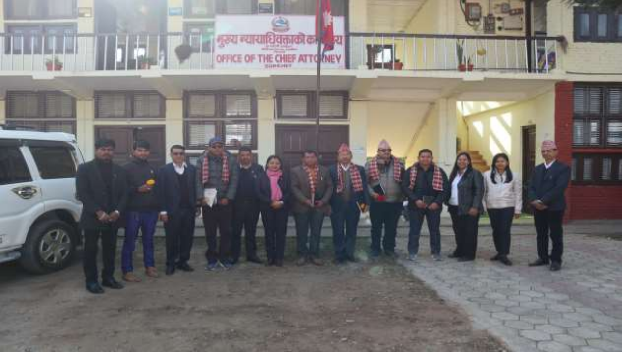
मुख्य न्यायाधिवक्ताको कार्यालय गण्डकी प्रदेशमा अनुभव आदान प्रदान कार्यक्रम