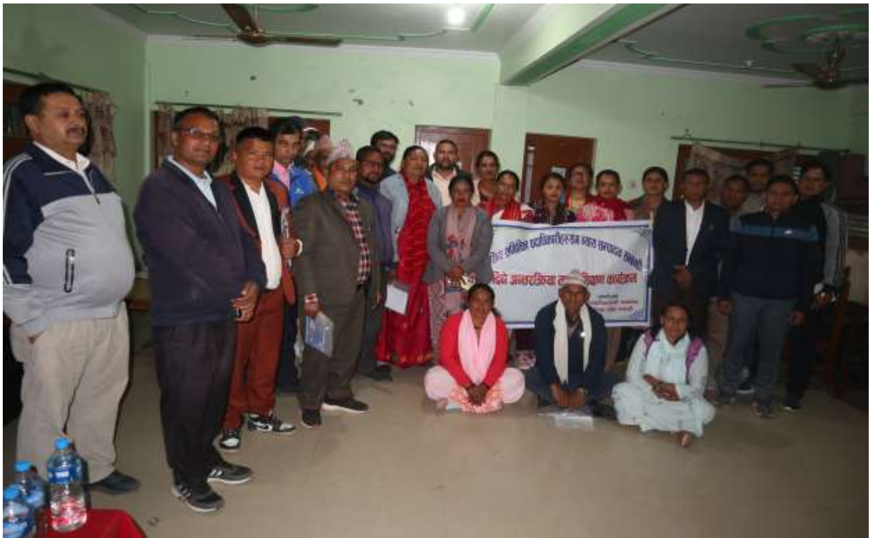
कञ्चनपुर जिल्लाका न्यायिक समितिका पदाधिकारीहरूसँगको अन्तरक्रिया कार्यक्रम