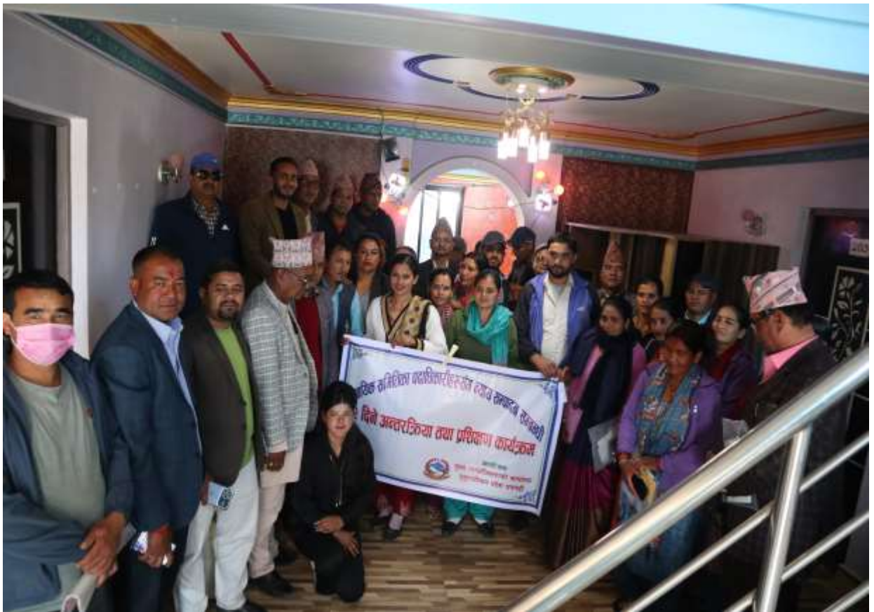
डडेलधुरा जिल्लाका न्यायिक समितिका पदाधिकारीहरूसँगको अन्तरक्रिया कार्यक्रम