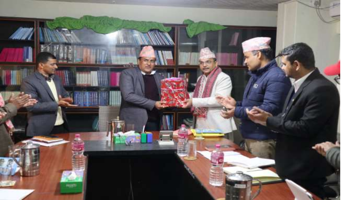
मुख्य न्यायाधिवक्ताको कार्यालय लुम्बिनी प्रदेशमा अनुभव आदान प्रदान कार्यक्रम