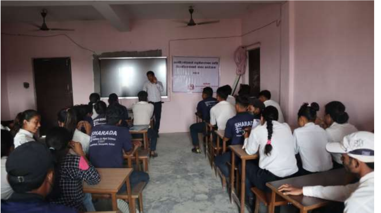
श्री सरस्वती माध्यामिक विद्यालय मनिहरा, धनगढी उ.म.न.पा. वडा नं.-७, कैलाली