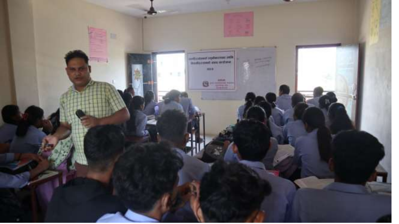
श्री दुर्गालक्ष्मी नमुना माध्यामिक विद्यालय अत्तरीया, गोदवारी न.पा. वडा नं.- २,कैलाली