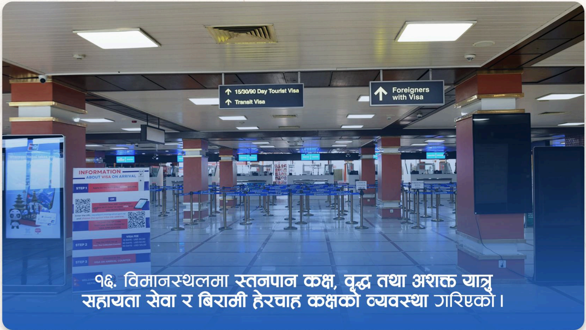
१६. विमानस्थलमा स्तनपान कक्ष, वृद्ध तथा अशक्त यात्रु सहायता सेवा र बिरामी हेरचाह कक्षको व्यवस्था गरिएको ।