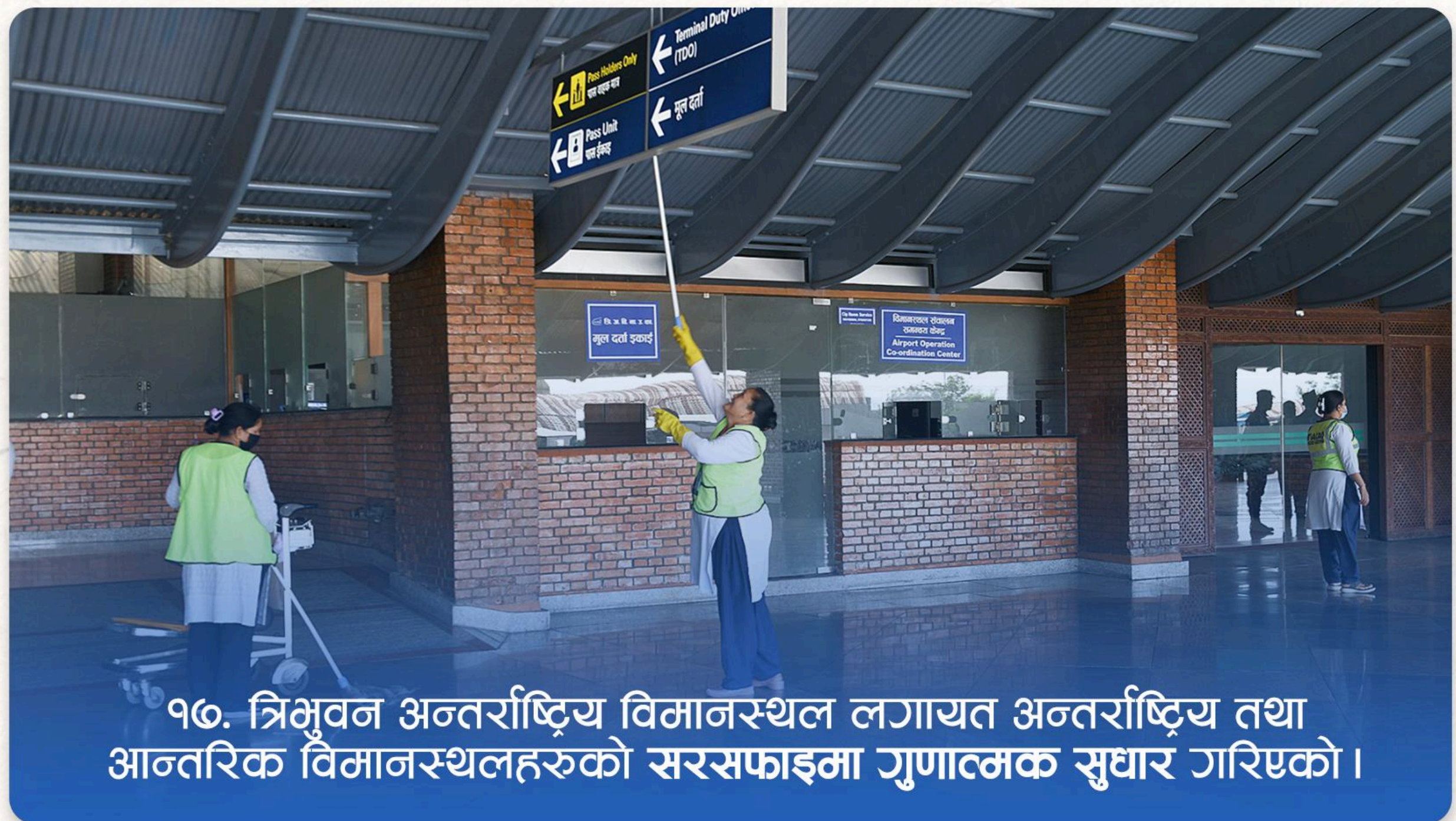
१७. त्रिभुवन अन्तर्राष्ट्रिय विमानस्थल लगायत अन्तर्राष्ट्रिय तथा आन्तरिक विमानस्थलहरुको सरसफाइमा गुणात्मक सुधार गरिएको ।