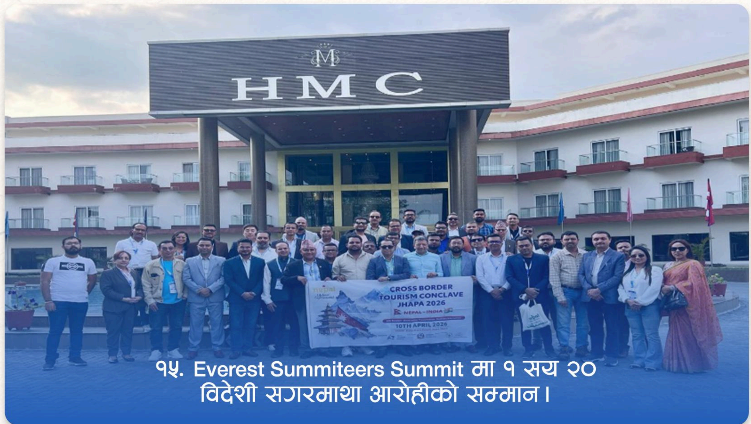
१५. Everest Summiters Summit मा १ सय २० विदेशी सगरमाथा आरोहीको सम्मान ।