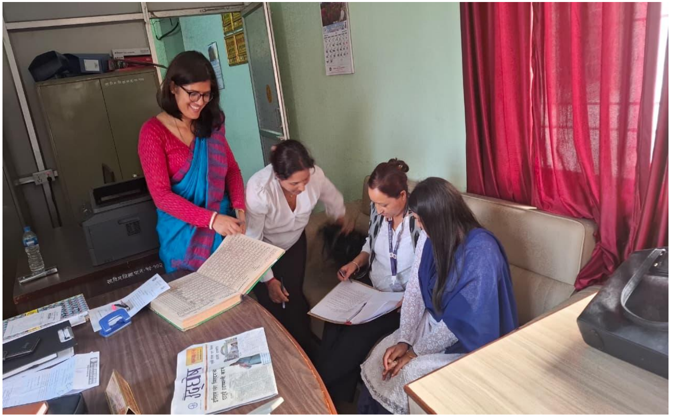
जेसी अडिट गर्दाका तस्विरहरु