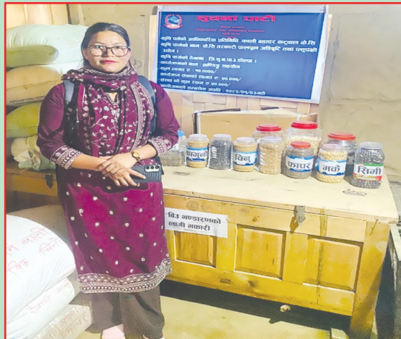
त्रिपुरासुन्दरी गा.पा., डोल्पा- ब्राण्डिडमा सहयोग