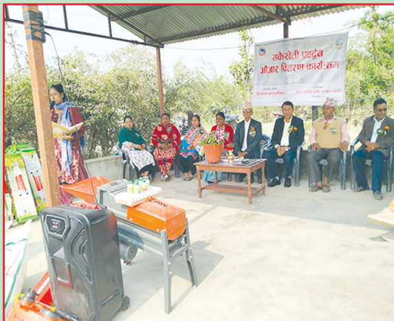
तिलोत्तमा न.पा., रुपन्देही- मकै खेती उन्नत प्रविधि कृषक तालिम