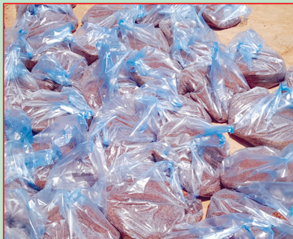
फिदिम न.पा., पाँचथर- रैथाने बीउको मिनिटीट वितरण