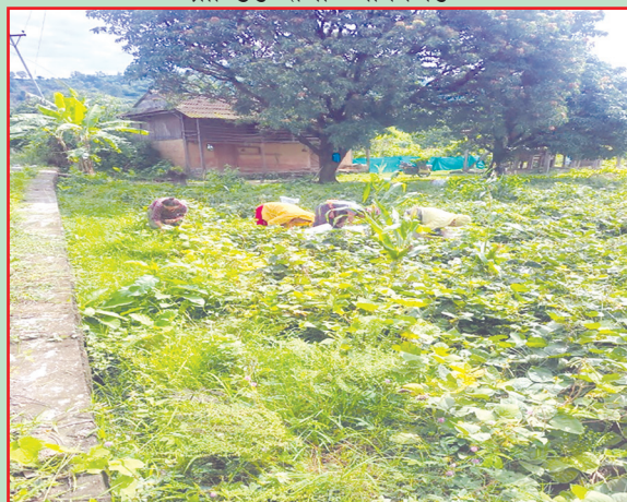
निजगढ न.पा., बारा- क्षेत्र विस्तार कार्यक्रम