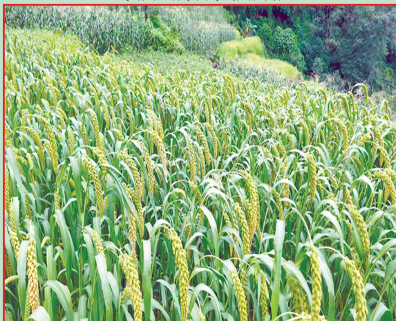
क्व्होलासोथार गा.पा., लमजुङ- ९९ रोपनी क्षेत्रफलमा कागुनो खेती गरिएको