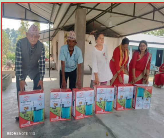
कमल गा.पा., झापा- स्प्रे ट्याङ्की वितरण स्थानीय तह प्रगति पुस्तिका (आ.व. २०८१/८२)