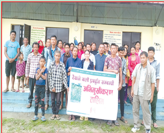
मरिण गा.पा., सिन्धुली- अभिमुखीकरण तालिम सञ्चालन