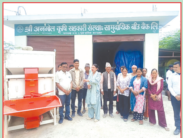
लालझाडी गा.पा., कन्चनपुर- बीउ प्रेडिड मेसिन खरिद तथा व्यवस्थापन