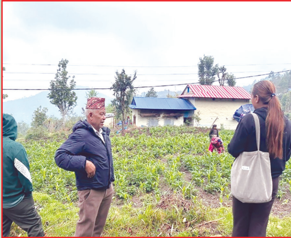
थुलुङ दुधकोशी गा.पा., सोलुखुम्बु- मकैको क्षेत्र विस्तार गरिएको