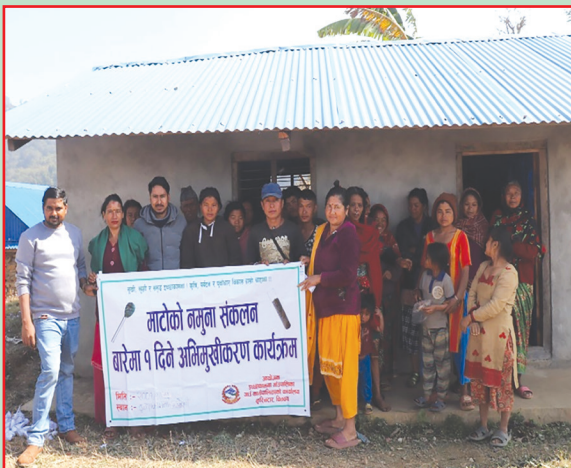
इच्छाकामना गा.पा., चितवन-माटोको नमूना परीक्षण शिविर