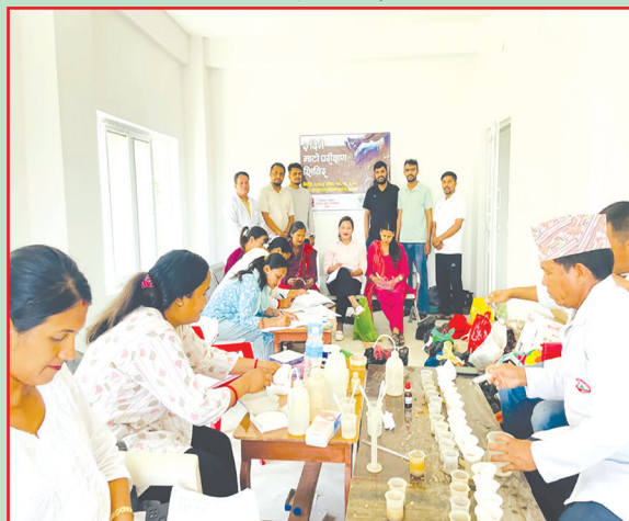
शारदा न.पा., सल्यान- माटो परीक्षण कार्यक्रम सञ्चालन