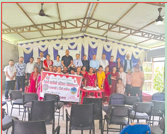
जैमिनी न.पा., बागलुङ- रैथाने परिकार विविधीकरण तालिम