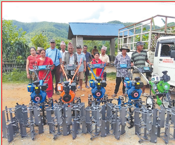
शुक्लागण्डकी न.पा., तनहुँ- कृषि यान्त्रिकरण वितरण