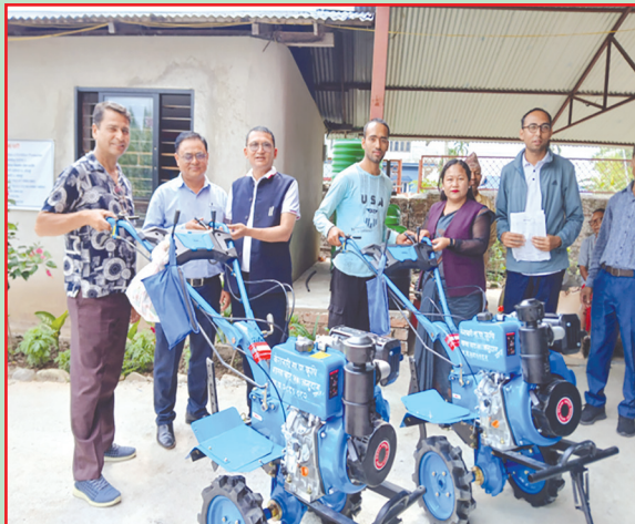
केरावारी गा.पा., मोरङ- चैते धान बीउ वितरण, यान्त्रीकरणमा सहयोग