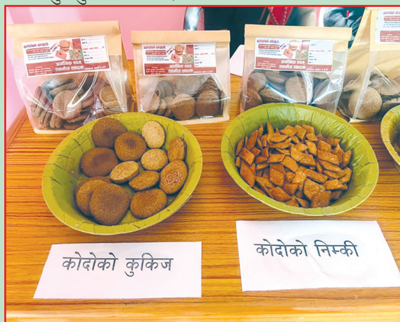
हलेसी तुवाचुङ न.पा., खोटाङ- कोदोको परिकार ब्राण्डिड तथा प्याकेजिङ