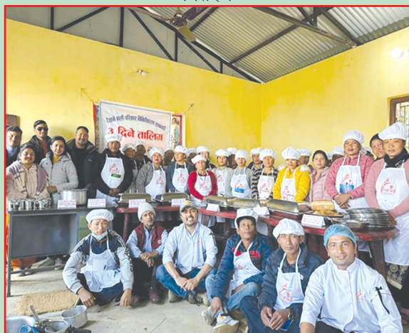
गण्डकी गा.पा., गोरखा- रैथाने बाली परिकार विविधीकरण तालिम सञ्चालन