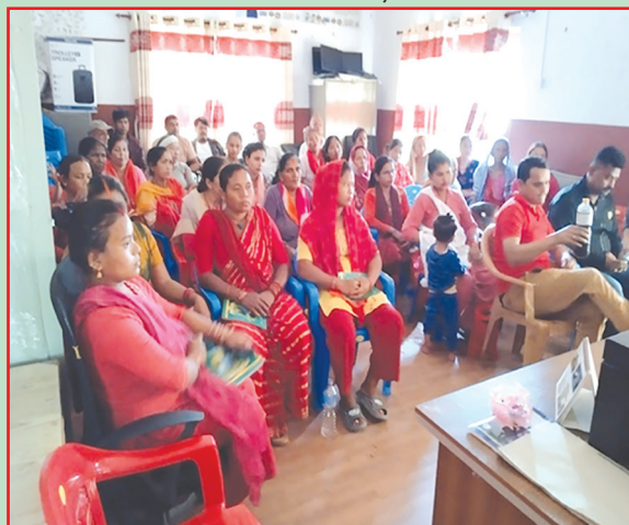
तिलोत्तमा न.पा., रुपन्देही- धान खेती उन्नत प्रविधि कृषक तालिम सञ्चालन