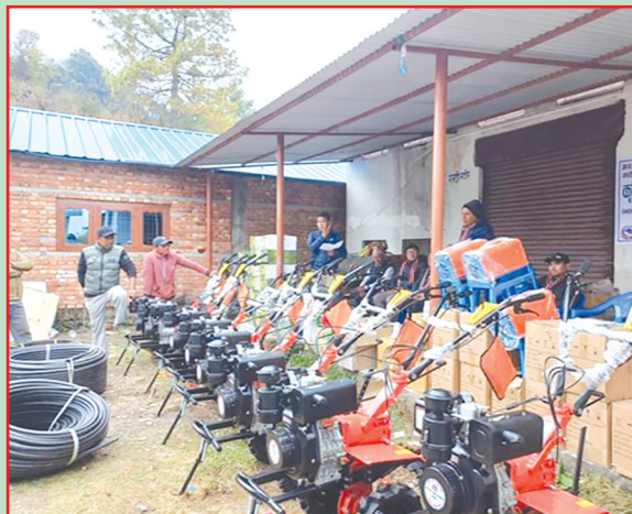
थाहा न.पा., मकवानपुर- कृषि औजार सामग्रीहरू वितरण