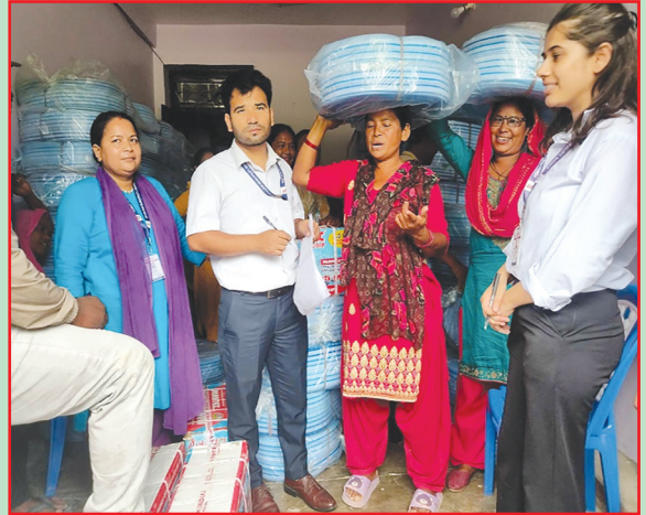
कोहलपुर न.पा., बाँके- कृषि सामग्री वितरण