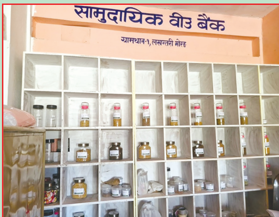
ग्रामथान गा.पा., मोरङ- बीउ बैंक सुदृढीकरण