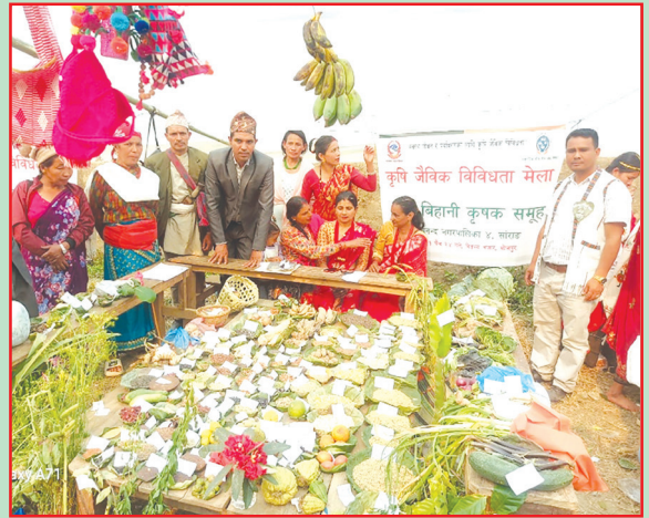
तेस्रो राष्ट्रिय कृषि जैविक विविधता दिवस तथा सप्ताह २०८१, कृषि विभाग, हरिहरभवन, ललितपुर