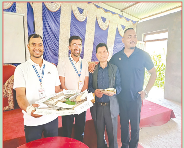
जैमिनी न.पा., बागलुङ- दिवा खाजा कार्यक्रम सञ्चालन