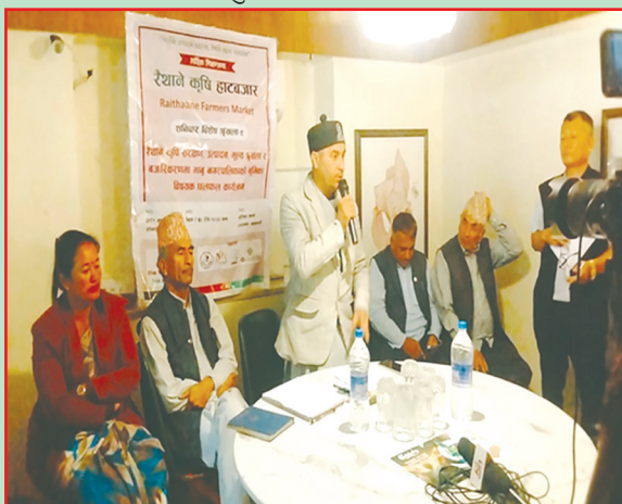
भानु न.पा., तनहुँ- रैथाने कृषि हाट बजार