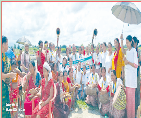
बराहक्षेत्र न.पा., सुनसरी- चैते धान क्षेत्र विस्तार कार्यक्रम गरिएको