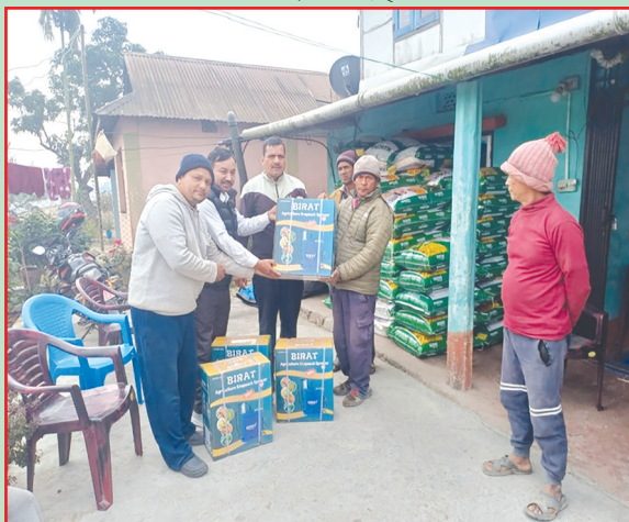
उर्लावारी न.पा., मोरङ- चैते धान बीउ तथा स्प्रेयर वितरण