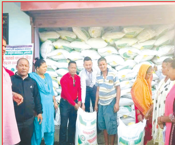
मरिण गा.पा., सिन्धुली- उन्नत बीउ वितरण