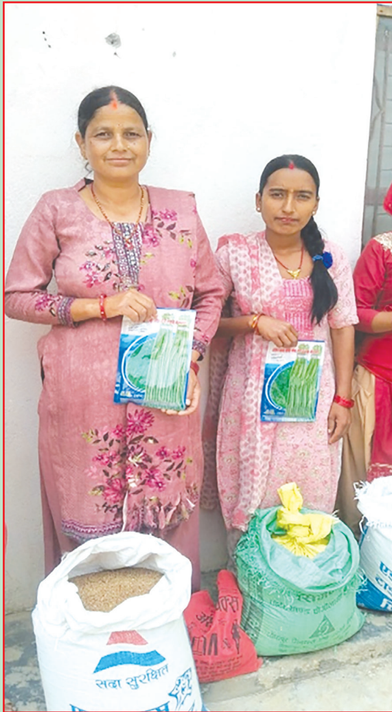
कुमाख गा.पा. सल्यान- रैथाने बालीको बीउ वितरण