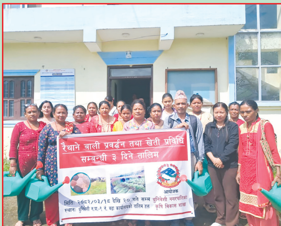
धनुर्वेंसी न.पा., धादिङ- रैथाने बालीसम्बन्धी तालिम सञ्चालन