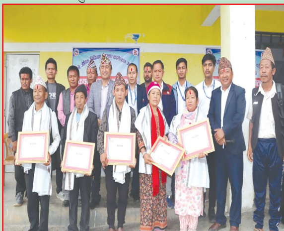
केपिलासगढी गा.पा., खोटाङ- जैविक विविधता सम्बन्धी कृषक सम्मान कार्यक्रम