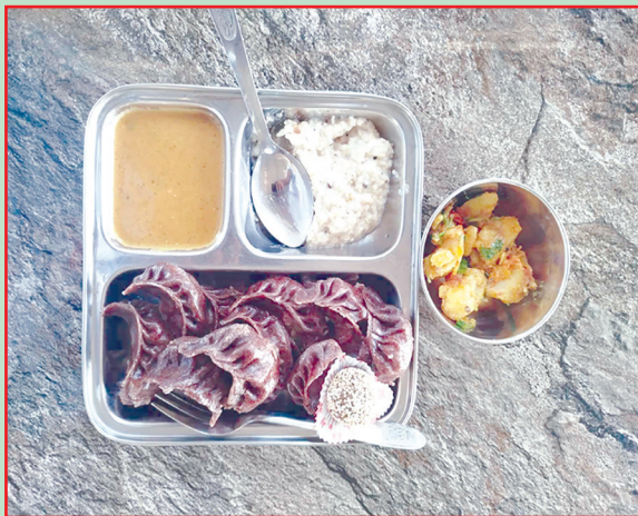
धुनीबेशी न.पा., धादिङ्ग- विद्यालयको दिवा खाजामा रैथाने परिकार समावेश