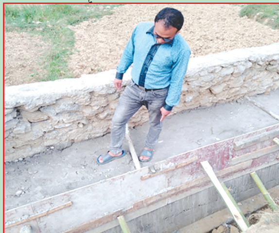
भानु न.पा., तनहुँ- साना सिँचाइ अन्तर्गत कुलो निर्माण