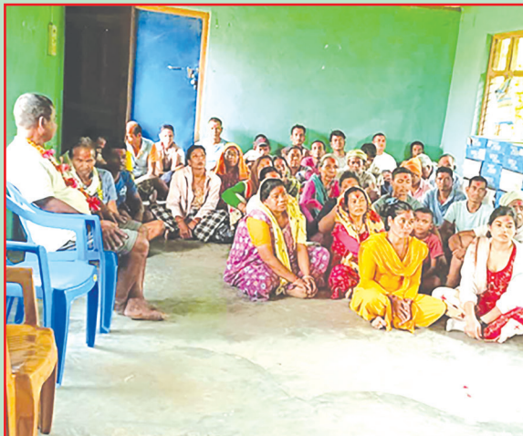
घोडाघोडी न.पा., कैलाली- चैते धान खेती गर्ने कृषकहरूलाई नगद प्रोत्साहन अनुदान