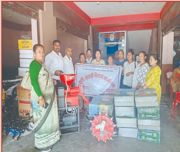
लालबन्दी न.पा., सर्लाही- कृषि सामग्री वितरण