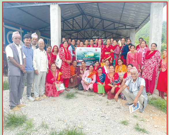
घिरिङ गा.पा., तनहुँ- तालिम सञ्चालन