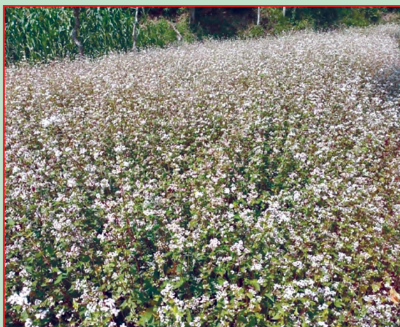
आठराई गा.पा., तेह्रथुम- फापर खेती, कोदो ब्याड बनाई खेती गरिएको