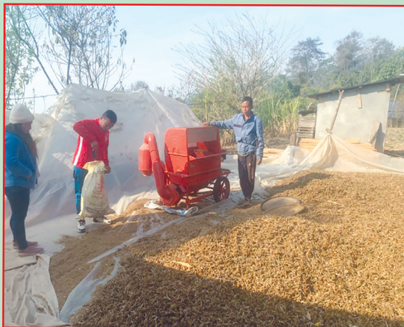
दिक्तेल रूपाकोट मझुवागढी न.पा., खोटाङ- रैथाने मसुरो र बोडीको बीउ वितरण