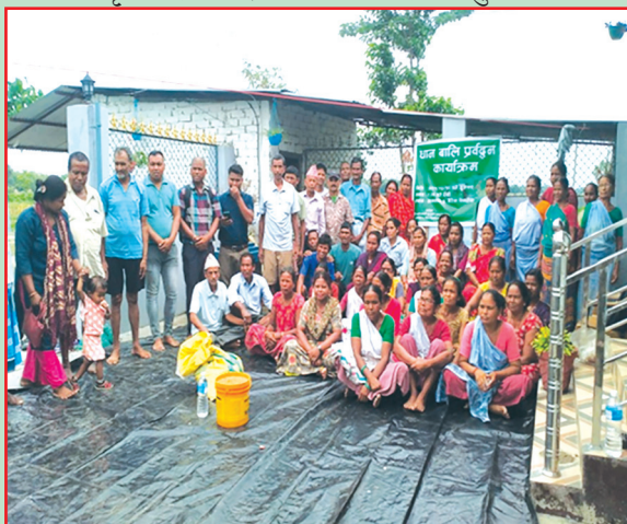
ग्रामथान न.पा., मोरङ- धानको ५०% अनुदानमा उन्नत बीउ वितरण