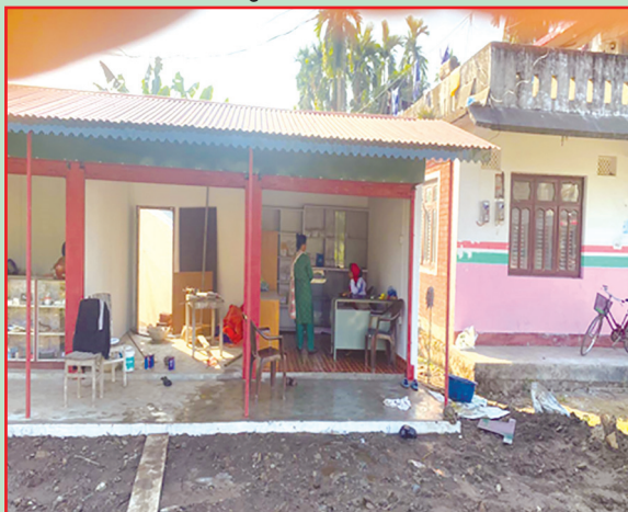
लेटाड न.पा., मोरङ- कोशेली घर स्थापना