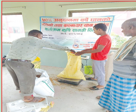
बारागढी गा.पा., बारा- बीउ, झारनासक, कीटनासक विषादी वितरण