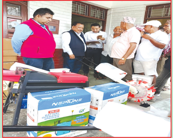
कचनकवल न.पा., झापा- कृषि मेसिनरी वितरण