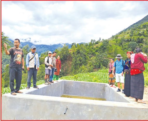
सुनछहरी गा.पा., रोल्पा- भकारो सुधार, पोखरी निर्माण