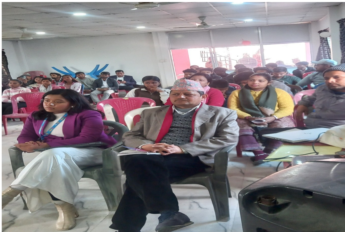
खाद्य सुरक्षामा युवाको भूमिका छलफल कार्यक्रम महत्तरी