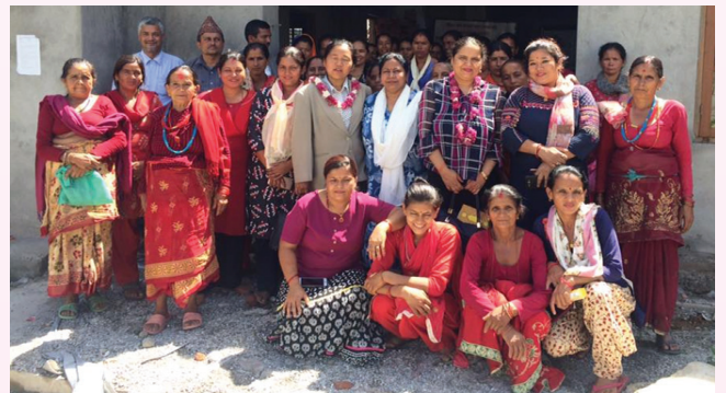
राष्ट्रपति महिला उत्थान कार्यक्रमका निर्देशक समिति सदस्य प्रतिनिधी सभा र राष्ट्रिय सभाका माननीय सदस्यज्यूहरूबाट जिविकोपार्जन सुधार कार्यक्रमको स्थलगत अनुगमन