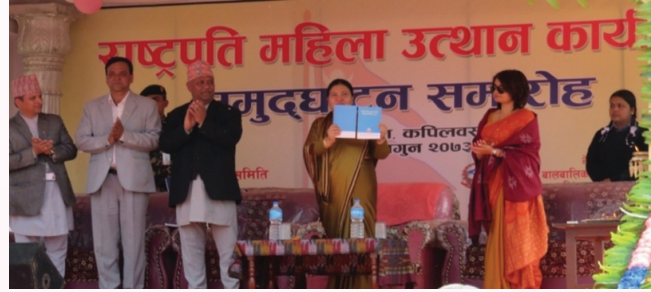
सम्माननीय राष्ट्रपति विद्यादेवी भण्डारीज्यूबाट राष्ट्रपति महिला उत्थान कार्यक्रमको समुदघाटन

कार्यक्रमको कार्यान्वयनबाट महिलाहरूको आर्थिक, सामाजिक, सांस्कृतिक, शैक्षिक स्वास्थ्य र राजनैतिक सूचकहरूमा सकारात्मक परिवर्तन देखिएको छ। राष्ट्रका महत्वपूर्ण पक्षहरूमा