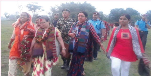
जीविकोपार्जन सुधार कार्यक्रमको माननीय मन्त्रिज्यूद्वारा स्थलगत अनुगमन

जम्मा ३० (भोजपुर, उदयपुर, ओखलढुङ्गा, सङ्खुवासभा, सिरहा, धनुषा, महोत्तरी, सर्लाही, रौतहट, सिन्धुली, रसुवा, सिन्धुपाल्चोक, दोलखा, नवलपुर, गोरखा, बाग्लुङ, म्याग्दी, कपिलवस्तु, प्युठान, पूर्वी रुकुम, रोल्पा, हुम्ला, मुगु, कालीकोट, डोल्पा, बझाङ, बाजुरा, अछाम, डोटी) जिल्लामा कार्यक्रम सञ्चालन भएको ।