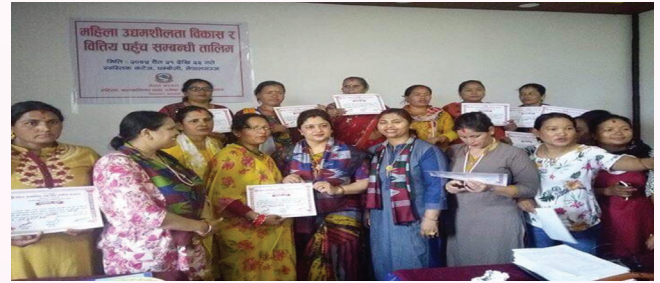
महिला उद्यमशीलता विकास र वित्तीय पहुँच सम्बन्धी तालिम