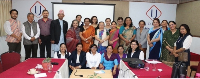
मन्त्रालयका पदाधिकारी निर्देशक समिति, विज्ञ समूह तथा परामर्शदाता समिलित अन्तरक्रिय गोष्ठी