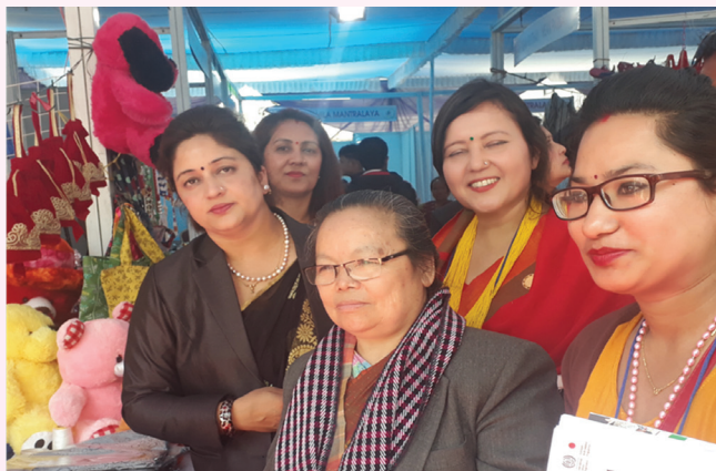
राष्ट्रिय प्रदर्शनी मेला अवलोकन