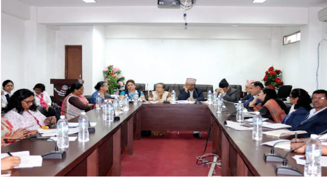
राष्ट्रपति महिला उत्थान कार्यक्रम निर्देशक समितिको बैठक ।

राष्ट्रपति महिला उत्थान कार्यक्रमलाई प्रभावकारी रूपमा संचालन गर्न तथा भइरहेको प्रगतिको समीक्षा गर्न विज्ञ समूह तथा निर्देशक समितिसँग नियमित बैठक, छलफल तथा अन्तरकृया संचालन भइरहेको छ ।