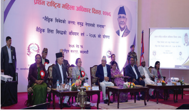
प्रथम राष्ट्रिय महिला अधिकार दिवस २०७६,

“लैङ्गिक विभेदको अन्त्य: समृद्ध नेपालको गन्तव्य” भन्ने मूल नाराका साथ महिला, बालबालिका तथा ज्येष्ठ नागरिक मन्त्री माननीय थममाया थापाको अध्यक्षतामा सम्माननीय प्रधानमन्त्री