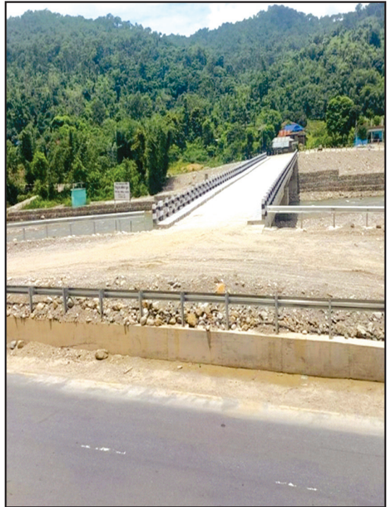
त्रियुगा खोला पक्की पुल, त्रि.न.पा. ७, तोरीबारी, उदयपुर