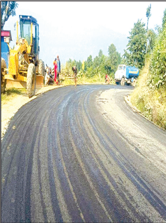
गुठिटार बाघखोर छिदि सडक, धनकुटा