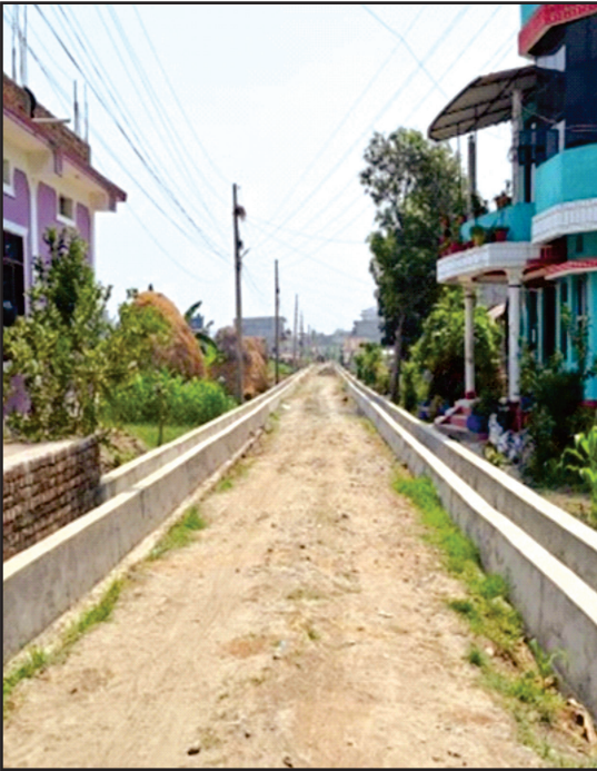
ड्रेन निर्माण काव्यबाटिका, इटहरी