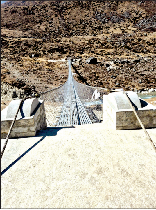
फेरिचे खोला झोलुङ्गे पुल, सोलुखुम्बु (४३०० मि. उचाईमा अवस्थित)