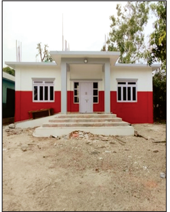
सव डिभिजन वन कार्यालय बेलस्रोत कटारी, उदयपुर