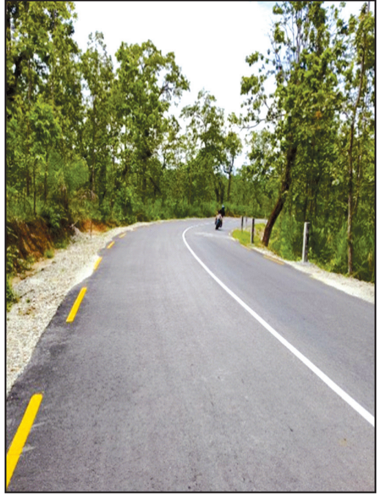
दुर्गापुर- दानाबारी सडक, झापा