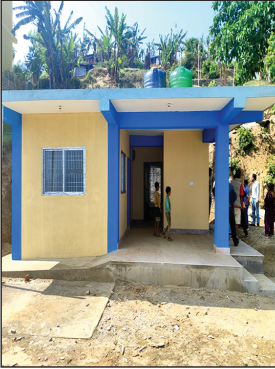
खानिडाँडा शहरी स्वास्थ्य केन्द्रको भवन निर्माण दि.रु.म.न.पा.-४, खोटाङ