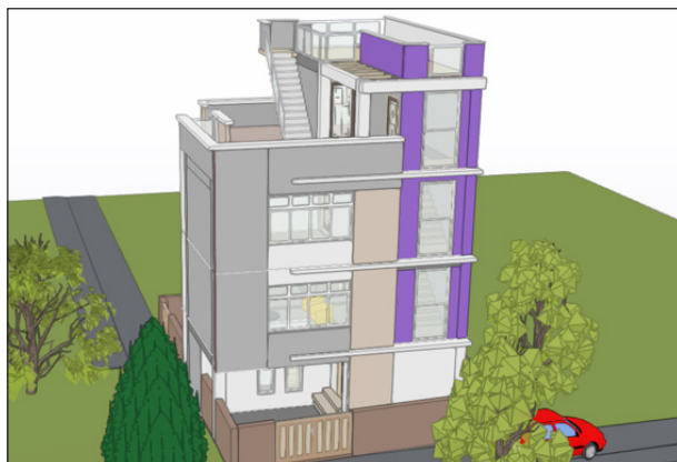
BIM नमुना २