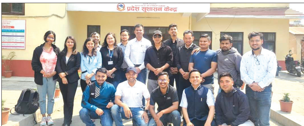
बागमती प्रदेश अन्तर्गत नगरपालिकाका प्राविधिकका लागि प्रदेश सुशासन केन्द्र, ललितपुरमा ५ दिने तालिम

नोट : ललितपुर महानगरपालिका र सूर्यविनायक नगरपालिका BCWP लागू गर्ने प्रक्रियामा छन् ।