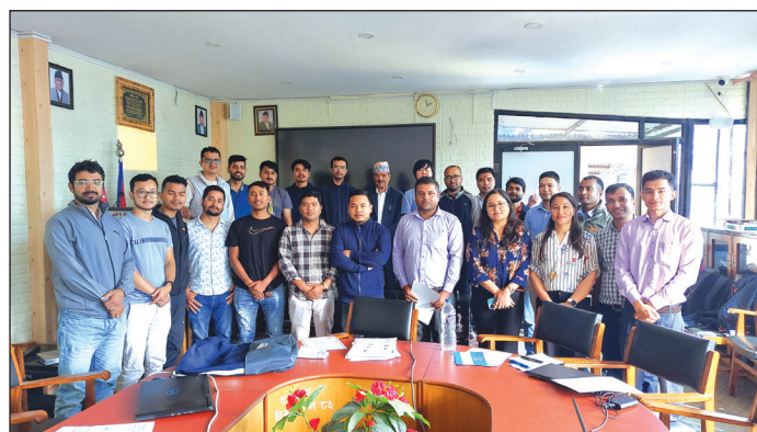
दक्षिणकाली नगरपालिकामा आयोजित तीन दिने तालिमको बेला खिचिएको सामुहिक फोटो

पुराना कागजी ईजाजतपत्र/डकुमेन्टहरू डिजिटलिकरण गरी डिजिटल ढाँचामा राखी कागजपत्रहरू सजिलै खोज्न सकिने हुँदा सुचनाको पहुँचलाई छिटो छरितो बनाउँदछ ।