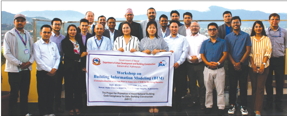
BIM सम्बन्धी एक दिने कार्यशालाको सामुहिक फोटो