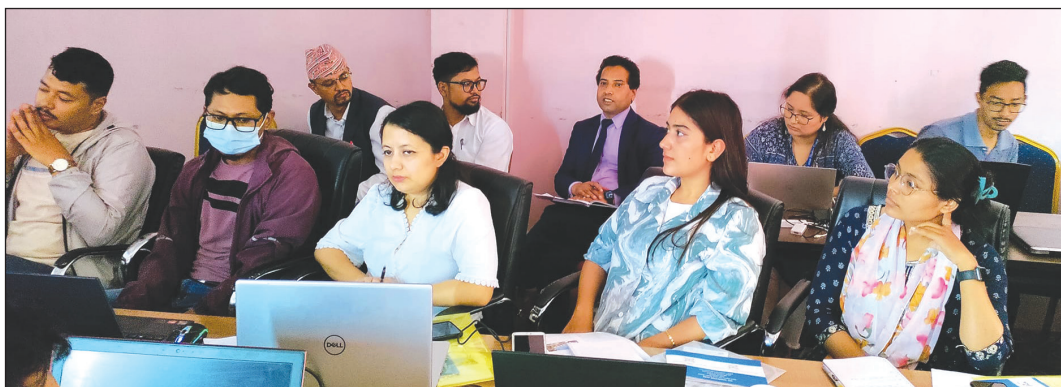
टोखा नगरपालिकामा डिजाईनर तथा सुपरिवेक्षण परामर्शदाताहरूलाई दुई दिने तालिम सम्पन्न