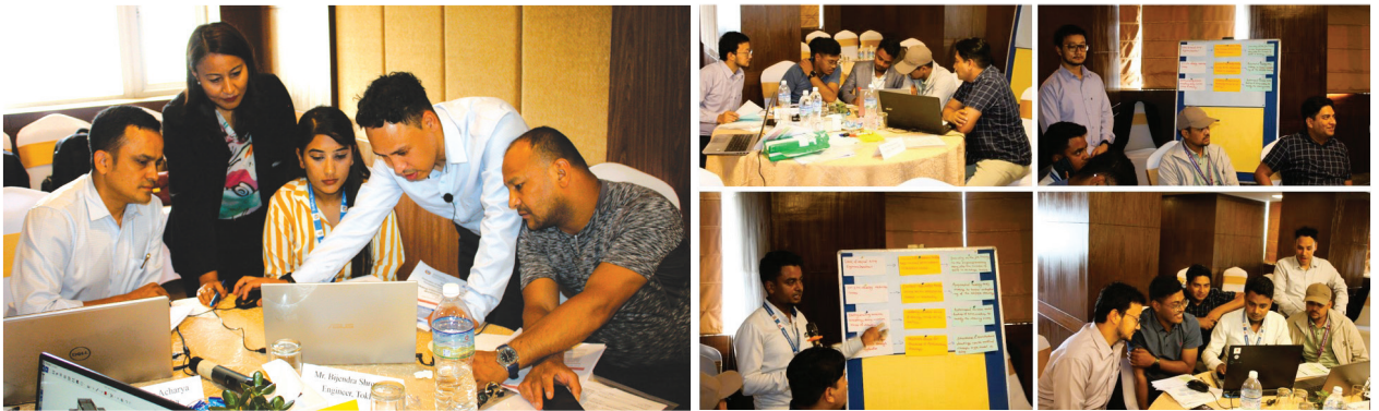
NBC अनुसार Architectural and Structural अनुपालन चेकलिष्टलाई BIM नमुनामा कसरी प्रयोग गर्ने भन्ने बारेमा सहभागीहरू छलफल गर्दै

नेपालमा हाल प्रचलित भवन निर्माणको स्वीकृति प्रक्रिया र अनुपालन प्रक्रियालाई आधुनिकीकरण गर्न सकिन्छ भन्ने सम्भावनालाई आत्मसात गर्दै DUDBC द्वारा BIM को बारेमा श्रावण ४, २०८१ मा एक दिने कार्यशाला गोष्ठी सम्पन्न गरियो। नेपालमा केही सरकारी र निजी क्षेत्रका आयोजनाहरूमा BIM को प्रयोग गरिएको छ। BIM को प्रयोग गरिएका सरकारी परियोजनाहरू मध्ये बुटवल सम्मेलन केन्द्र, कोशी अस्पताल, लुम्बिनी प्रादेशिक अस्पताल आदि हुन्।