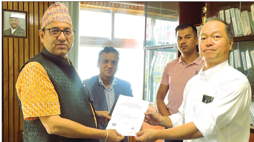
BIM सम्बन्धी कार्यशालाको रिपोर्ट DUDBC लाई हस्तान्तरण गर्दै