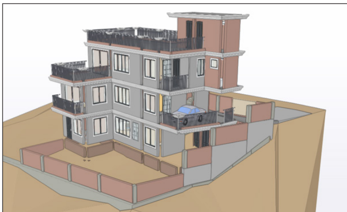
BIM नमुना १