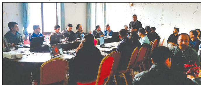
तारकेश्वर नगरपालिकामा डिजाइनर तथा सुपरिवेक्षण परामर्शदाताको तालिममा सामुहिक छलफल

निर्माणकार्यको स्तर तथा पद्धति थप सुधार गर्नका लागि नगरपालिकाहरूद्वारा गरिने नेपाल राष्ट्रिय भवन संहिता र भवन निर्माण मापदण्डको अनुपालनको चेकजाँच र मूल्याङ्कनको शहरी विकास तथा भवन निर्माण विभागद्वारा अनुगमन गर्न सक्नेछ ।