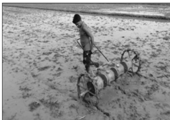
8४ l; 8/af6 jlp 5b{