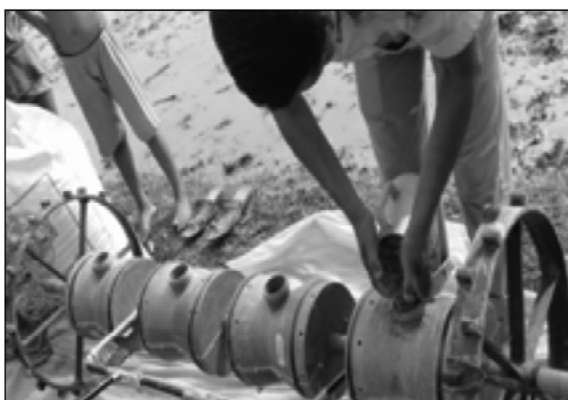
8४ l; 8/df jlp eb{