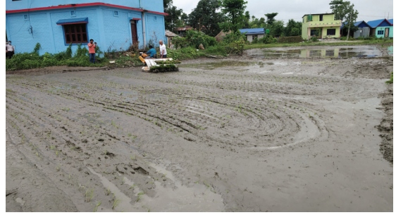
राइस ट्रान्सपलान्तरबाट रोपाई हुदै