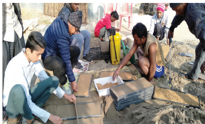
प्लाष्टिक ट्रेमा धान नर्सरी तयारी गर्दै