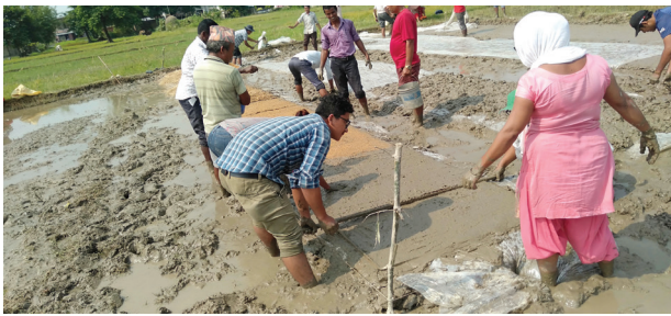
नर्सरी ब्याडमा माटो सम्प्याउदै र बीउ छर्दै