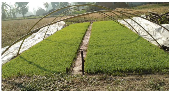
धुले म्याट नर्सरी

हिउँदे धानमा चिसो बाट जोगाउन गुमोज बनाई रातको समयमा छोप्रे । विहानको समयमा लट्टीले शित झार्ने ।