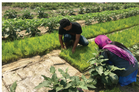
राइस ट्रान्सपलान्टरबाट रोप्नको लागि म्याट काट्दै