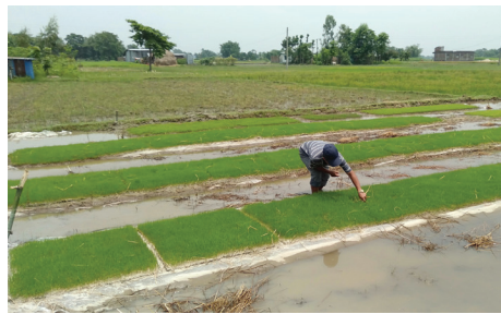
७ दिनको म्याट धान नर्सरी