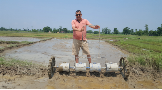
ड्रम सिडरमा वीउ भर्दै