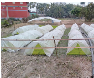
चिसोबाट जोगाउन प्लाष्टिक गुमोजले छोपेको