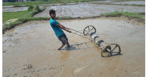
ड्रम सिडरबाट वीउ छर्दै