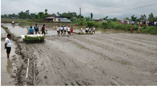
ट्रान्सपलान्तरबाट रोप तयारी अवस्थाको खेत