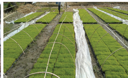
प्लाष्टिक ट्रेमा तयार गरिएको धान नर्सरी