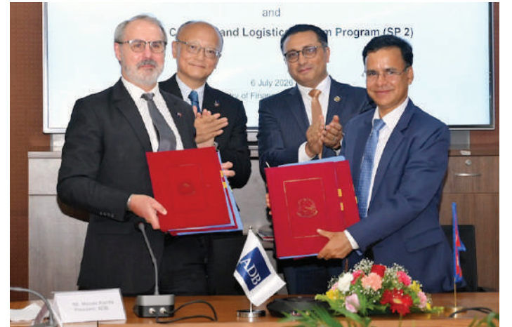
'एडिबी सँग सहयोगी'

सम्झौता अनुसार यो ऋण एकीकृत खानेपानी तथा ढल व्यवस्थापन आयोजना र 'दक्षिण एसिया उपक्षेत्रीय आर्थिक सहयोग र रसद सुधार उपकार्यक्रम' मा परिचालन हुने छ। यसमध्ये आयोजनाका लागि १७ अर्ब ५० करोड रुपियाँ (११ करोड ५० लाख अमेरिकी डलर) र उपकार्यक्रमका लागि करिब सात अर्ब ६० करोड (पाँच करोड अमेरिकी डलर) रुपियाँ परिचालन हुने अर्थ मन्त्रालयले जारी गरेको विज्ञापना उल्लेख छ।