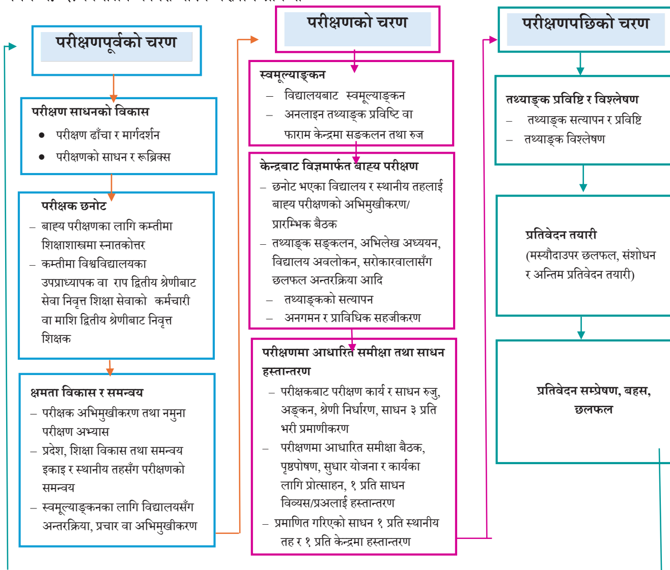
चित्र नं. ३: विद्यालय कार्यसम्पादन परीक्षण प्रक्रिया

विद्यालय कार्यसम्पादन परीक्षण कार्यलाई विश्वसनीय तथा व्यवस्थित बनाउन, प्रक्रियामा संलग्न सरोकारवालाको कार्यशैलीमा एकरूपता ल्याउन, सबैको एकै किसिमको बुझाइका लागि समग्र परीक्षण प्रक्रियालाई निम्नानुसार निर्धारण गरिएको छः