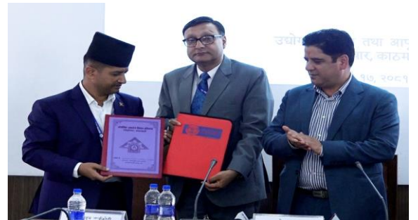
समझदारीपत्रमा हस्ताक्षर कार्यक्रम

नेपाल सरकारको यस सहूलियत कर्जा प्रदान गर्न औद्योगिक व्यवसाय विकास प्रतिष्ठान र राष्ट्रिय वाणिज्य बैङ्कबीच २०८१ भाद्र १७ गते समझदारीपत्रमा हस्ताक्षर भएको छ । स्टार्टअप उद्यम कर्जा कार्यक्रमअन्तर्गत कर्जा प्रवाह गर्दा उद्यमीको परियोजनालाई नै धितोको रूपमा राखेछ । प्रत्येक स्टार्टअप कर्जाको सुरक्षण पनि निक्षेप तथा कर्जा सुरक्षण कोषमा राखे व्यवस्था छ ।