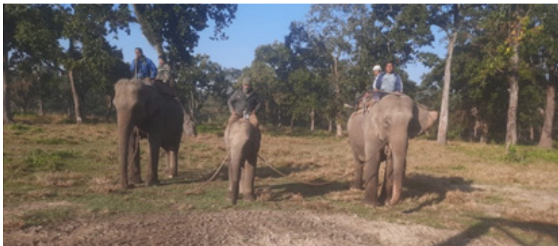
बच्चा हात्तीलाई तालीम

आ.व. २०८०/०८१ मा यस निकुञ्जको हात्ती प्रजनन केन्द्र, खोरसोरमा रहेका ५ वटा बच्चा हात्तीलाई तालिम दिईएको छ। प्रजनन केन्द्रमा रहेका रुद्रकली, शिवगंज, मन बहादुर गज, कमलप्रसाद र बुद्धगज हात्तीहरूलाई तालीम दिईएको हो। दुई वटा ठूला हात्तीहरूको बीचमा बच्चा हात्ती राखेर करिब १ महिना तालिम दिने गरिन्छ। हात्तीलाई कमाण्ड गर्ने साथै हात्तीको अनिबानीमा सुधार ल्याउने, गस्ती तथा वन्यजन्तु उद्धार कार्यमा प्रयोग गर्ने उद्देश्यले बच्चा हात्तीलाई तालीम प्रदान गरिएको थियो। प्रशिक्षित कर्मचारी र भेटेरिनरी डाक्टरहरूको प्रत्यक्ष निगरानीमा तालिम सञ्चालन गरिएको थियो।