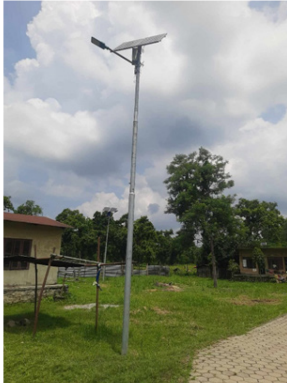
सोलार आउटडोर ल्याम्प जडान