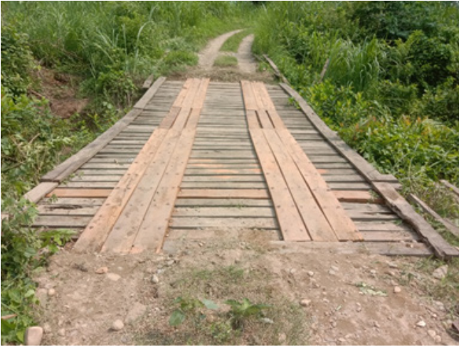
काठे पुल मर्मत (चरहरा)