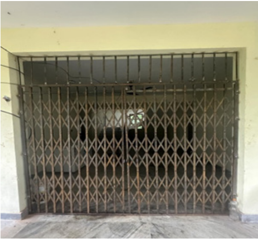
चेन गेट निर्माण (देवनगर रे पो)