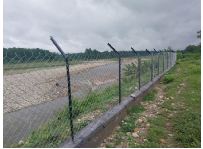
मेषजाली सहित तारवार निर्माण