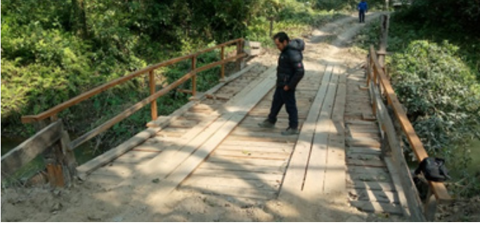
काठे पुल मर्मत (दुधौरा)