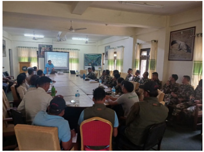
कर्मचारी/सेनालाई वन्यजन्तु उद्धार एवं ऐन नियम सम्बन्धी पुनर्ताजकी तालिम