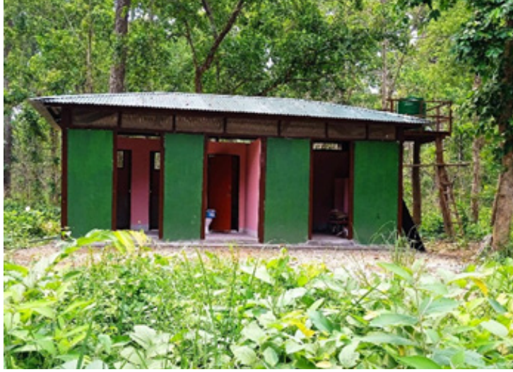
सार्वजनिक शौचालय निर्माण

पर्यटक तथा यात्रुहरूलाई विशेष मध्यनजर गर्दै आ.व. २०८०/०८१ मा चितवन राष्ट्रिय निकुञ्जको पुलगेटमा नेपाल सरकार र तराई भू-परिधि कार्यक्रमको सहकार्यमा १ वटा व्यवस्थित शौचालयको निर्माण गरिएको छ। जसबाट निकुञ्जको पर्यटकीय सरसफाई क्षेत्रमा योगदान पुगेको अनुभूति गरिएको छ।