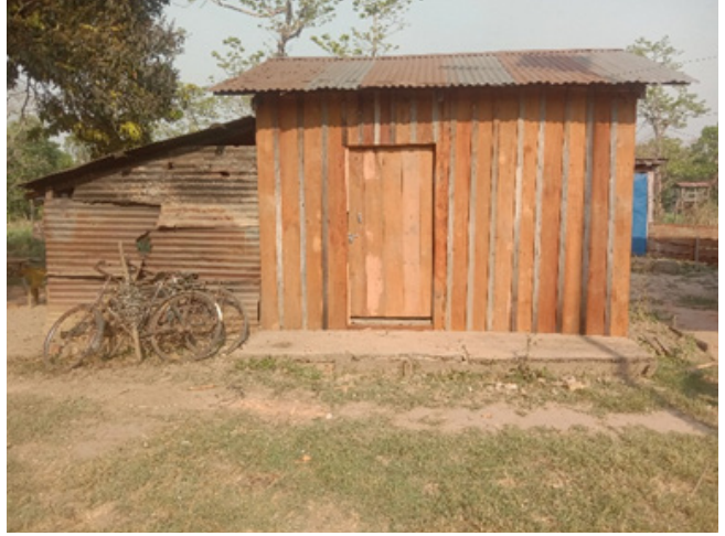
पोष्ट भवन मर्मत (कछुवानी)