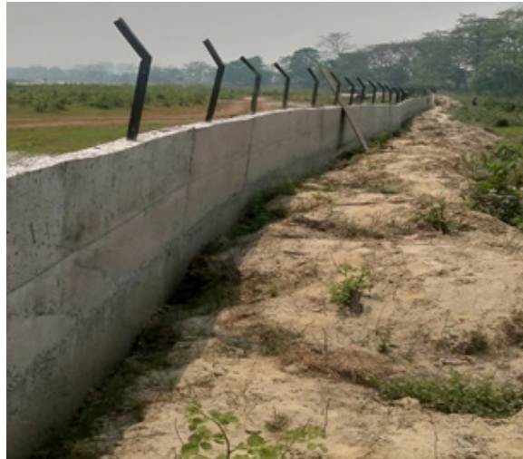
मेषजाली सहितको तारबार

निकुञ्ज तथा मध्यवर्ती वन क्षेत्रबाट वन्यजन्तु मानव वस्तीमा प्रवेश गरी गर्ने मानवीय, पशुधन, घरगोठ, र अन्नबाली लगायतका क्षतिबाट हुने मानव-वन्यजन्तु बीच द्वन्द्व न्यूनीकरण गर्न अर्थात मानव वस्तीमा वन्यजन्तुहरूको प्रवेश रोक्न निकुञ्ज कार्यालयले विभिन्न किसिमका न्यूनिकरणका उपायहरू अवलम्बन गर्दै आएको छ । जस अन्तर्गत यस आ.व. मा राष्ट्रिय निकुञ्ज तथा आरक्ष आयोजनाबाट मानव-वन्यजन्तु द्वन्द्व प्रभावित क्षेत्र मेघौली उपभोक्ता समितिको क्षेत्र, सिखौली उपभोक्ता समितिको क्षेत्र र अयोध्यपुरी उपभोक्ता समिति अन्तर्गत मा करिब ५ कि.मी. मेषजाली सहितको तारबार निर्माण गरिएको छ ।