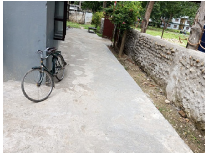
बन्दी गृह मर्मत सुधार