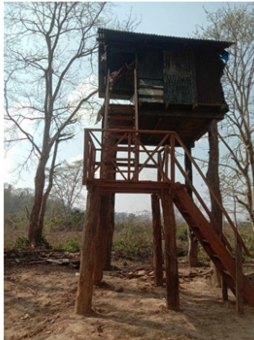
जिरो मचान मर्मत

वन्यजन्तु चोरी शिकार नियन्त्रणको लागि रातको समयमा एम्बुस बस्न आवश्यक महसुस गरी जिरो मचान र थपलिया तालको बाघ मचानको मर्मत गरिएको छ । साथै एम्बुस बस्ने मचानको लागि आवश्यक सामग्री खरिद गरिएको छ । यस कार्यबाट पर्यटकलाई वन्यजन्तु अवलोकन गर्न, निकुञ्जमा तैनाथ कर्मचारीहरूलाई गस्ती गर्न तथा एम्बुस बस्न समेत सहज भएको छ ।