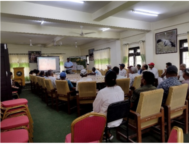
सामुदायिक वन व्यवस्थापन तालिम

यस निकुञ्जमा कार्यरत कर्मचारीहरू रेञ्जर, सिनियर गेमस्काउट, गेमस्काउट र हात्तीसारका कर्मचारीलाई क्षमता अभिवृद्धि गर्ने उद्देश्यले वन्यजन्तु उद्धार तथा व्यवस्थापन तालिम, सामुदायिक वन व्यवस्थापन तालिम तथा सरोकारवालहरूसंग अन्तक्रिया गोष्ठी लगायत अन्य तालिम तथा गोष्ठीहरू सञ्चालन गरिएको थियो । उक्त तालीमहरूमा संरक्षण क्षेत्रहरूको बारेमा, निकुञ्जको ऐन कानून, नीति नियम, मध्यवर्ती सामुदायिक वन, चोरी शिकार तथा चोरी निकासी जस्ता अवैध क्रियाकलाप, वन्यजन्तुको आनीवानी सम्बन्धी, मानव-वन्यजन्तु द्वन्द्व, वन्यजन्तु उद्धार तथा व्यवस्थापन, मुद्दा सम्बन्धि विविध जानकारीहरू सहित नियमित गस्ती तथा नेपाली सेनासंगको समन्वय र सहकार्य बारेमा जानकारी गराईएको थियो । नेपालमा वन्यजन्तु संरक्षणमा निकुञ्ज प्रशासन, नेपाली सेना र स्थानीय जनसमुदायको भूमिका र योगदानको बारेमा समेत जानकारी गराउने गरी तालीम सञ्चालन गरिएको थियो ।