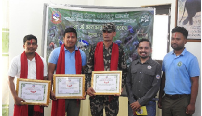
वन्यजन्तु सप्ताह, २०८१ (वैशाख १-७)