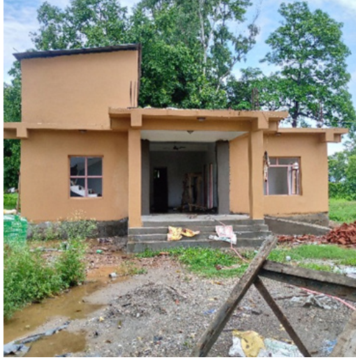
पोष्ट भवन निर्माण

यस आर्थिक वर्ष २०८०/०८१ मा निकुञ्जको सौराहा सेक्टर अन्तर्गतको हात्तीसारमा पोष्ट भवन निर्माण भएको छ ।