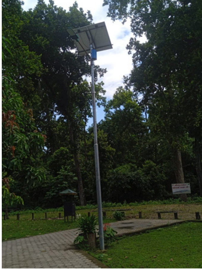
सोलार आउटडोर ल्याम्प (घडियाल संरक्षण तथा प्रजनन केन्द्र)

रातको समयमा वन्यजन्तु सम्बन्धी विभिन्न गतिविधिहरू तथा वन्यजन्तुबाट हुन सक्ने क्षतिबाट बच्ने उद्देश्यले निकुञ्जको अमृतेमा दुई वटा, कछुवानी एक वटा, डुमरिया एक वटा र घडियाल संरक्षण तथा प्रजनन केन्द्रमा एक वटा गरी जम्मा ५ वटा सोलार आउटडोर ल्याम्प जडान गरिएको छ। वन्यजन्तुबाट हुने सक्ने जोखिम बारे सतर्कता अपनाउन सक्ने अपेक्षा गरिएको छ।