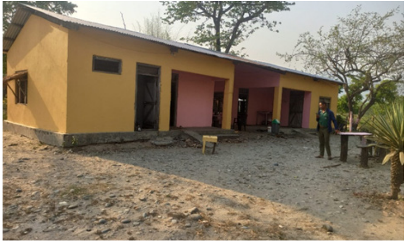
पोष्ट भवन मर्मत (दिव्यपुरी पोष्ट)