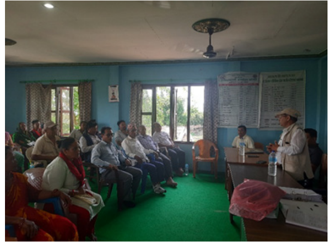
विश्व सिमसार दिवस-२०२४