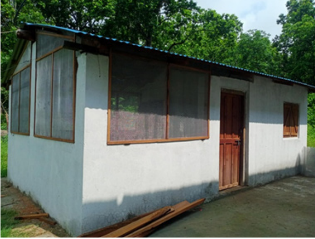
पोष्ट भवन मर्मत (दिपानगर)