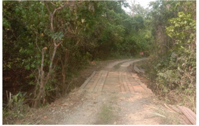
काठे पुल मर्मत (जर्नेली २)