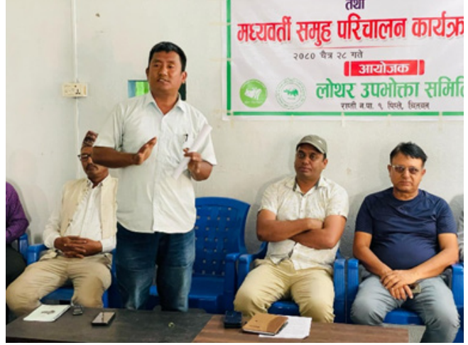
संरक्षण शिक्षा कार्यक्रम