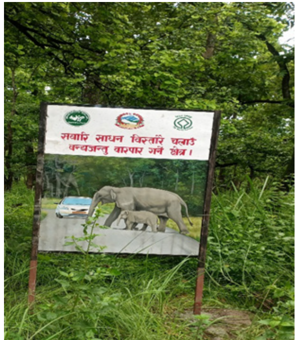
साईन बोर्ड निर्माण