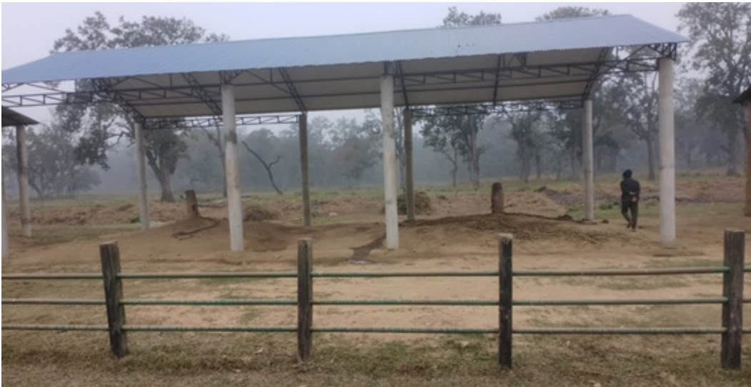
हातीको सेडघर, बेलशहर

निकुञ्जमा हातीहरूको लागि सेडघर अभाव भएको हुँदा निकुञ्जको हातीसार प्रजनन् केन्द्र खोरसोरमा १ वटा सेडघर निर्माण गरिएको छ । यस आ.ब मा आर.सी.सी. सहितको हात्तिको सेडघर निर्माण गरिएको छ । साथै खोरसोरमा नै हात्ती राख्ने सेडघरको मर्मत समेत गरिको थियो ।