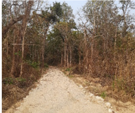
वन पथ ग्रामेलिङ्ग

निकुञ्जको पूर्वी सेक्टर सौराहाको अमृते देखि चपरचुली जाने बाटोको ४ कि.मि. दुरी क्षेत्रमा वन पथ ग्रामेलिङ्ग गरिएको छ । जसले गर्दा भिमपुर हुँदै अमृते चपरचुली जाने मूल बाटोको स्तरउन्नति भएको छ । वनपथ ग्रामेलिङ्ग कार्यले उक्त क्षेत्रहरूमा पेट्रोलिङ्ग, साईकल गस्ती, पैदल गस्ती लगायतका कृयाकलापमा सहयोग पुग्नुका साथै निकुञ्जको पर्या-पर्यटनमा समेत टेवा पुगेको छ ।