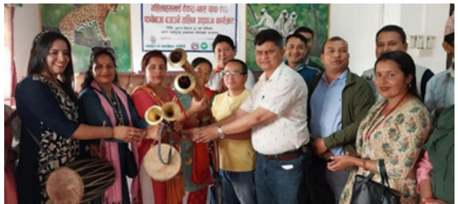
आय-आर्जन तथा सीप विकास कार्यक्रम