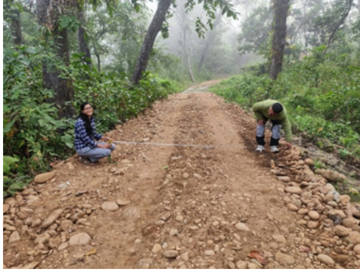
गोरेटो बाटो मर्मत