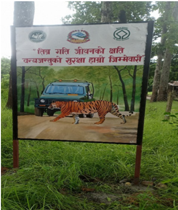
साईन बोर्ड निर्माण

निकुञ्ज क्षेत्रमा सूचना/साईन बोर्डको ठूलो महत्व रहेको छ । सूचना तथा साईन बोर्डले जंगलमा विभिन्न किसिमको जानकारी तथा सहजता प्रदान गर्दछ । तसर्थ यस आ.व. मा १४ वटा नयाँ सूचना/साईनबोर्ड निर्माण गरी निकुञ्जको विभिन्न क्षेत्र (विशेष गरी सुविधा प्राप्त बाटो) मा राखिएको छ ।