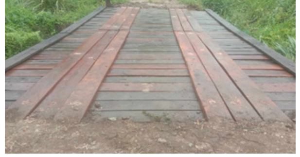
काठे पुल मर्मत (लगुना)