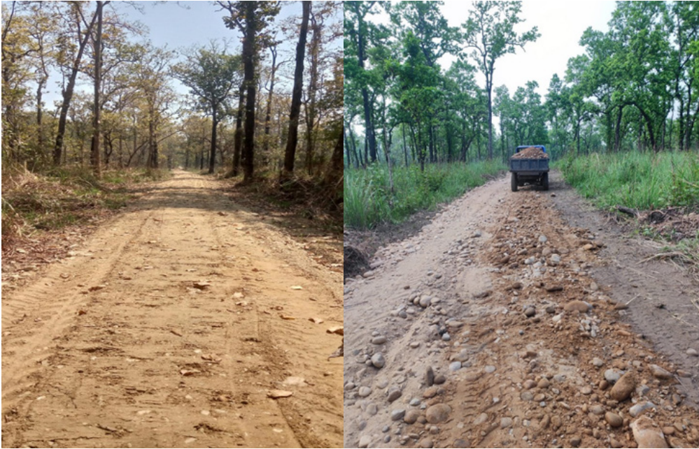
पदमपुर-प्रतापपुर वन पथ निर्माण

निकुञ्ज भित्रको चाँपखोला देखि उत्तरी क्षेत्रमा सम्म २ कि.मि. अग्निरेखा निर्माण गरिएको छ। निकुञ्जको कसरा देखि कमलतालसम्म क्षेत्रमा भुङ्गो सफाई तथा वनपथ मर्मत गर्ने कार्य सम्पन्न भएको छ।