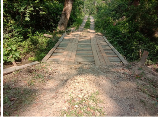
काठे पुल (पण्डित खोला)