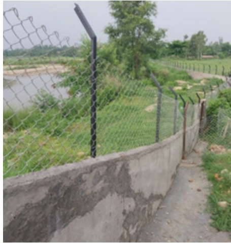
मेष जाली निर्माण