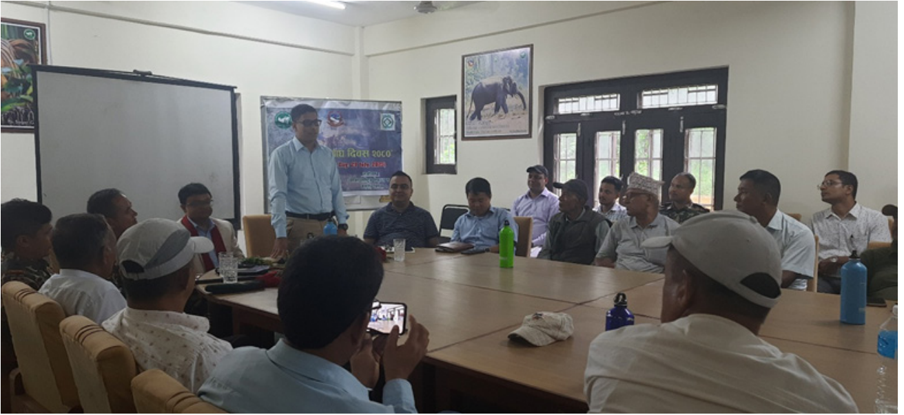
बाघ दिवस २०२३