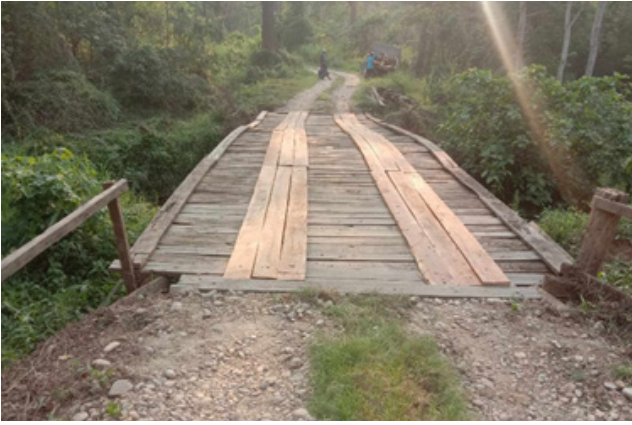
काठे पुल मर्मत (जर्नेली १)