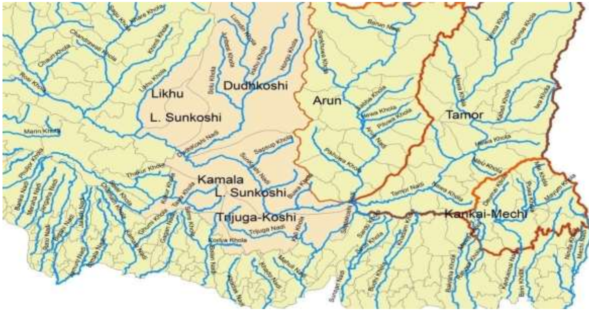
तालिका : १ प्रमुख जलाधार क्षेत्रहरु